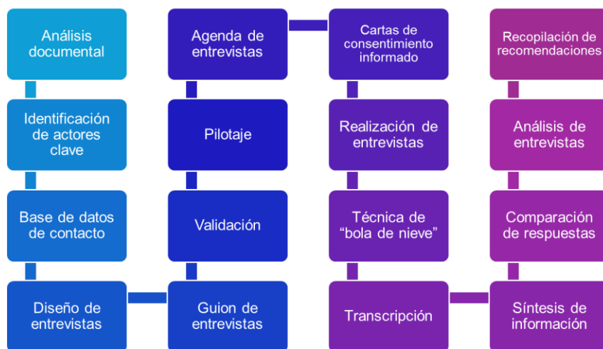
Figura 1. Ruta metodológica

A continuación, se presenta una ruta metodológica de los pasos que se siguieron para desarrollar esta investigación, y posteriormente una descripción detallada de cada uno.