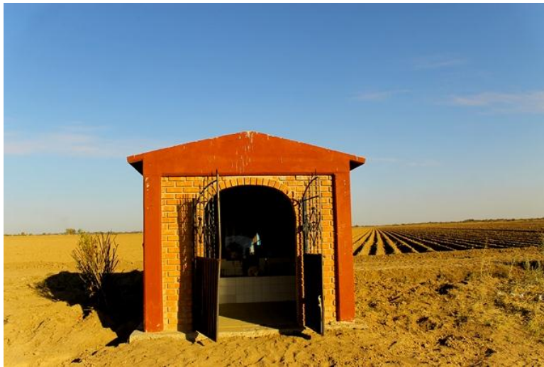
Capilla de El Álamo Santo. Al costado derecho de la construcción, se erguía el árbol.

Y azuzados por la prensa mexicalense que magnificó el hecho, día a día, sobre todo los fines de semana, cientos de visitantes empezaron a llegar. Se construyó un pequeño cerco, se cruzó el álamo con una imagen de la Virgen de Guadalupe, se ofrecieron ofrendas, veladoras, el árbol se empezó a llenar de fotografías de creyentes, fotos grandes, chicas, arreglos, y un sinfín de objetos cuelgan ahora del álamo, antes caído y hoy “santificado”. 152