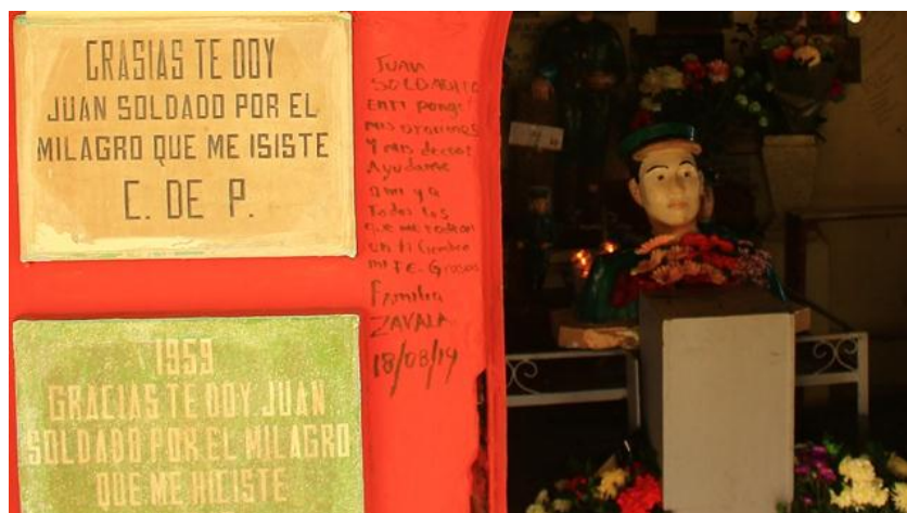
Exvotos en la capilla No. 1

Además, en los milagros realizados por Juan Soldado se percibe que su culto promueve compensadores específicos. Retomando a Alejandro Frigerio quien plantea que los compensadores son las recompensas obtenidas por los ruegos realizados. El autor hace una diferenciación entre compensadores generales y específicos. Los primeros son típicos de las grandes tradiciones religiosas, y promueven amplias recompensas, por ejemplo, vida eterna o trascendencia después de la muerte. Los segundos son más comunes en tradiciones mágicas y cultos religiosos recientes; estos tienen respuestas más precisas a los requerimientos de los creyentes, por ejemplo, curación a enfermedades, soluciones económicas, entre otras cosas. 117