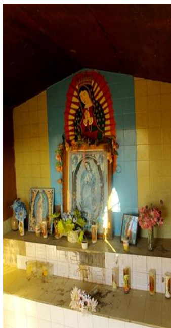
Interior de la capilla de El Álamo Santo

El álamo en invierno se seca, y ese no se secó nunca, se levantó verde, todo el follaje estaba verde. Por eso la gente estaba creyendo que era milagroso. Yo pienso que se levantó por la naturaleza, la raíz estaba viva abajo, estaba floreciendo y por eso se levantó. Yo pienso que eso que le salió la virgencita, yo pienso que de haber sido por la naturaleza. 191