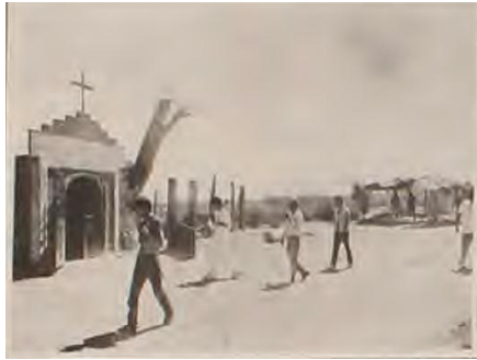
Visitas a El Álamo Santo 157

Para mediados del año 1990 El Álamo Santo era conocido por todo Mexicali, el valle y ciudades aledañas a ambos lados de la frontera. Era común ver los fines de semana las aglomeraciones de autos que buscaban un lugar cercano para estacionar. Con el correr de los meses ya eran varias las personas que manifestaban el poder curativo del árbol; y corrían los testimonios sobre los milagros. Pero la popularidad también provocó la muerte definitiva del tronco. De a poco los fieles fueron llevándose la corteza, hasta que al final lo descascararon por completo. La consecuencia fue la muerte definitiva del álamo.