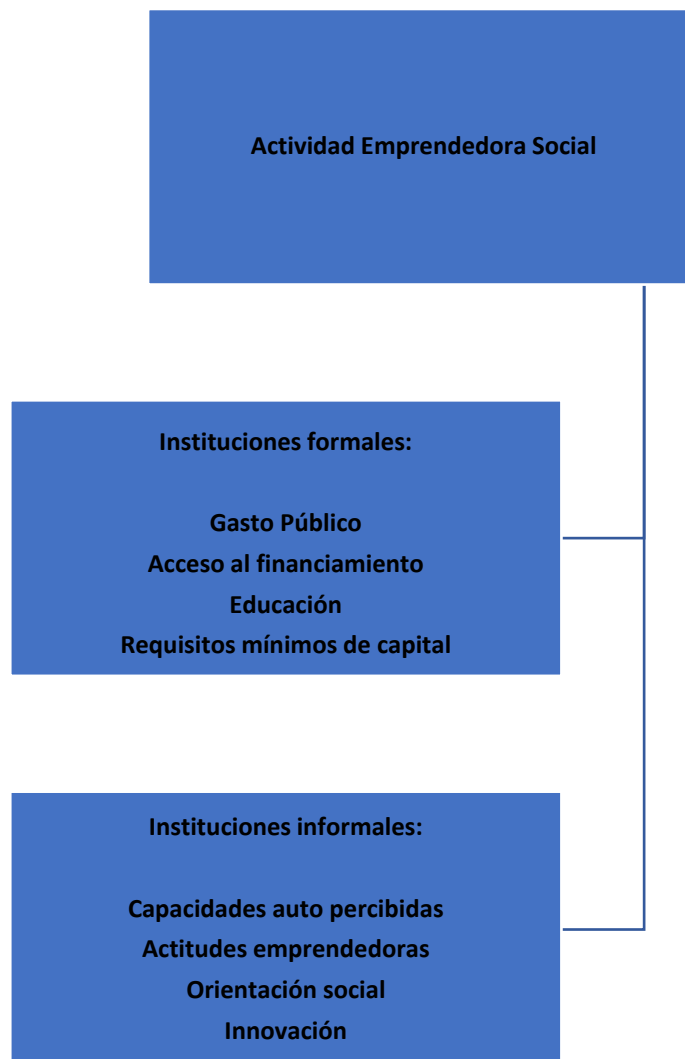
Figura 2. Factores Institucionales.