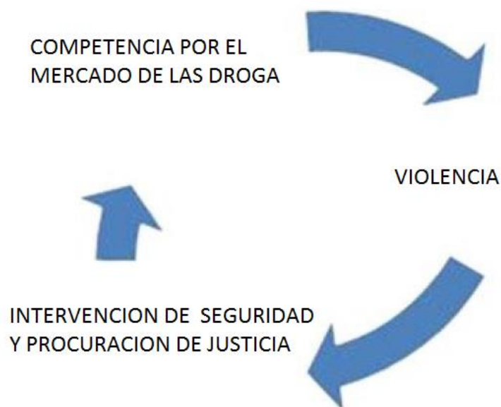
Figure 3. elf-reinforcing violent equilibrium.

En la ciudad de Tijuana se está en un círculo vicioso, en el cual el mercado de sustancias ilegales genera violencia, la violencia genera la intervención de la ley mediante operaciones de seguridad, lo que genera disputas para suplir los vacíos o las vacantes que generaron la captura o detención. Es un círculo vicioso que se tiene que romper si se quiere terminar con el problema, el mercado de compra venta de drogas genera violencia y la violencia genera que exista la intervención de la autoridad en donde se desmantela un grupo o la cabeza o jefe y se vuelva a generar una competencia por el mercado de compra venta de drogas.