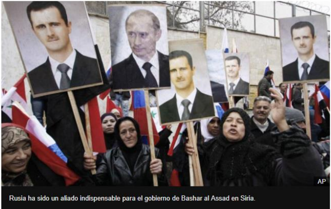
Rusia ha sido un aliado indispensable para el gobierno de Bashar al Assad en Siria.

https://www.bbc.com/mundo/noticias/2015/09/150920_internacional_rusia_siria_conflicto_guerra_inmigrantes_mr?fbclid=IwAR0fdHvqe8_9oSNK4b6I8fJB_V7ntdH_7T0n4ZOrBqjbhQRSe7AA9j_sqKY