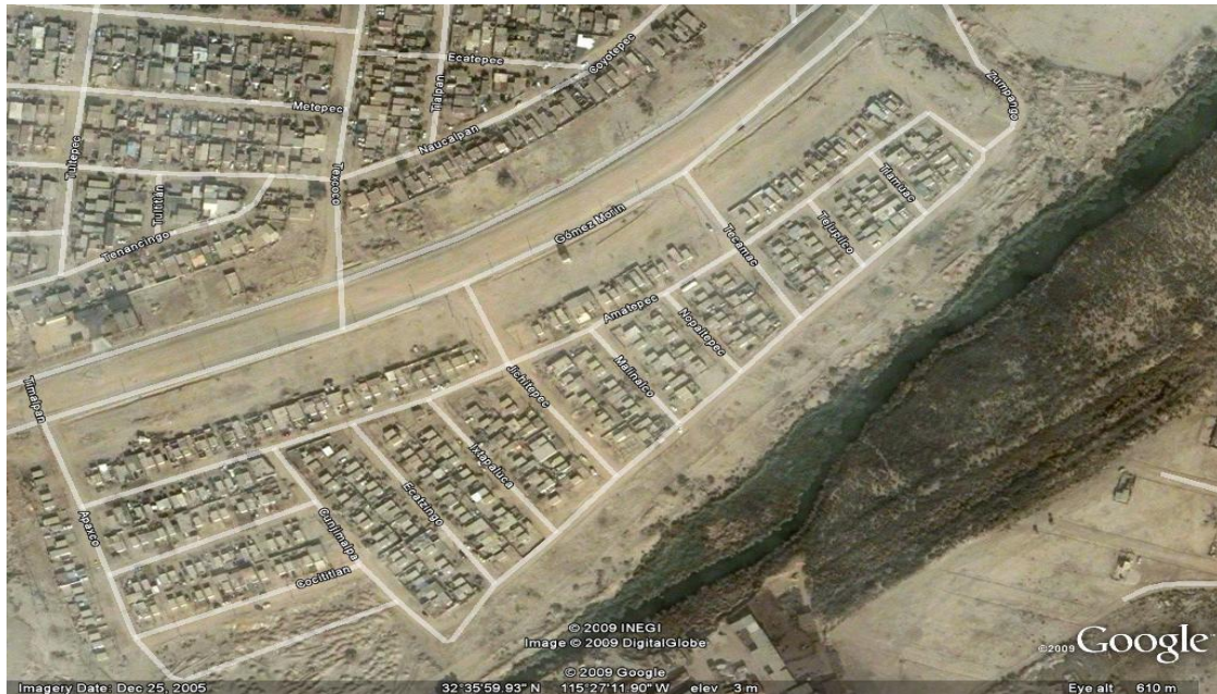
Figura 3. Fraccionamiento Ampliación Xochicali.