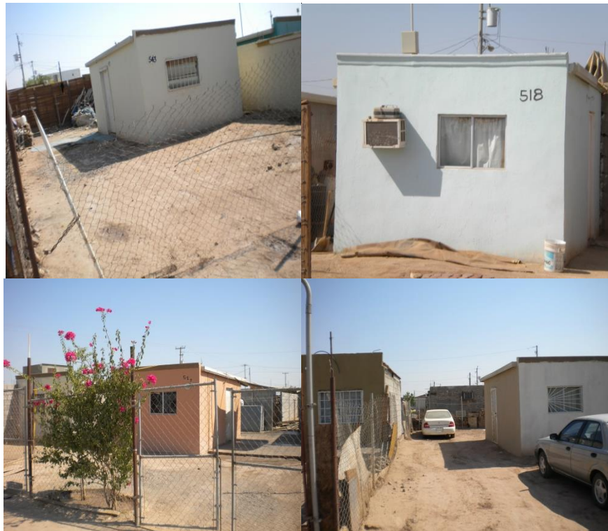
Figura 4. Viviendas sin ampliaciones.