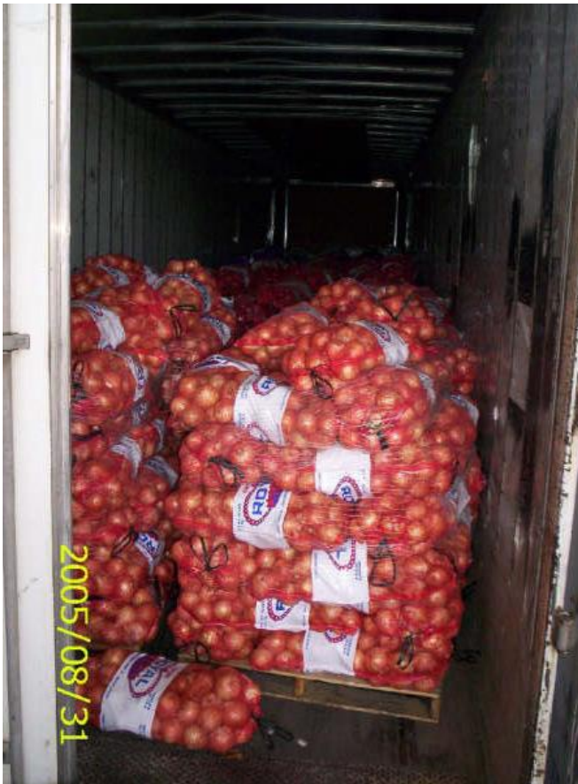
Costales de naranja