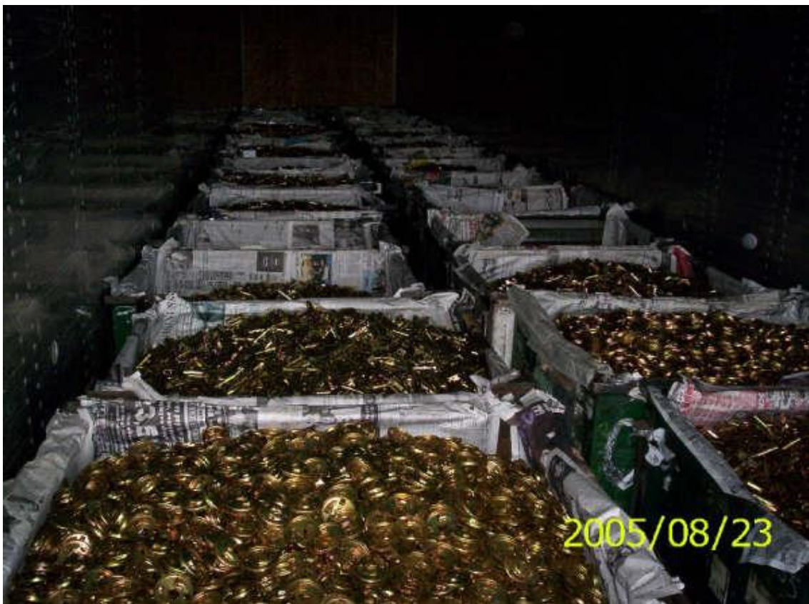
Accesorios para cerradura de puertas