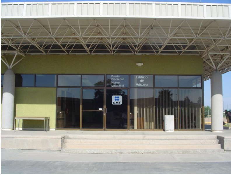
Edificio de Administración General de la Aduana de Mexicali