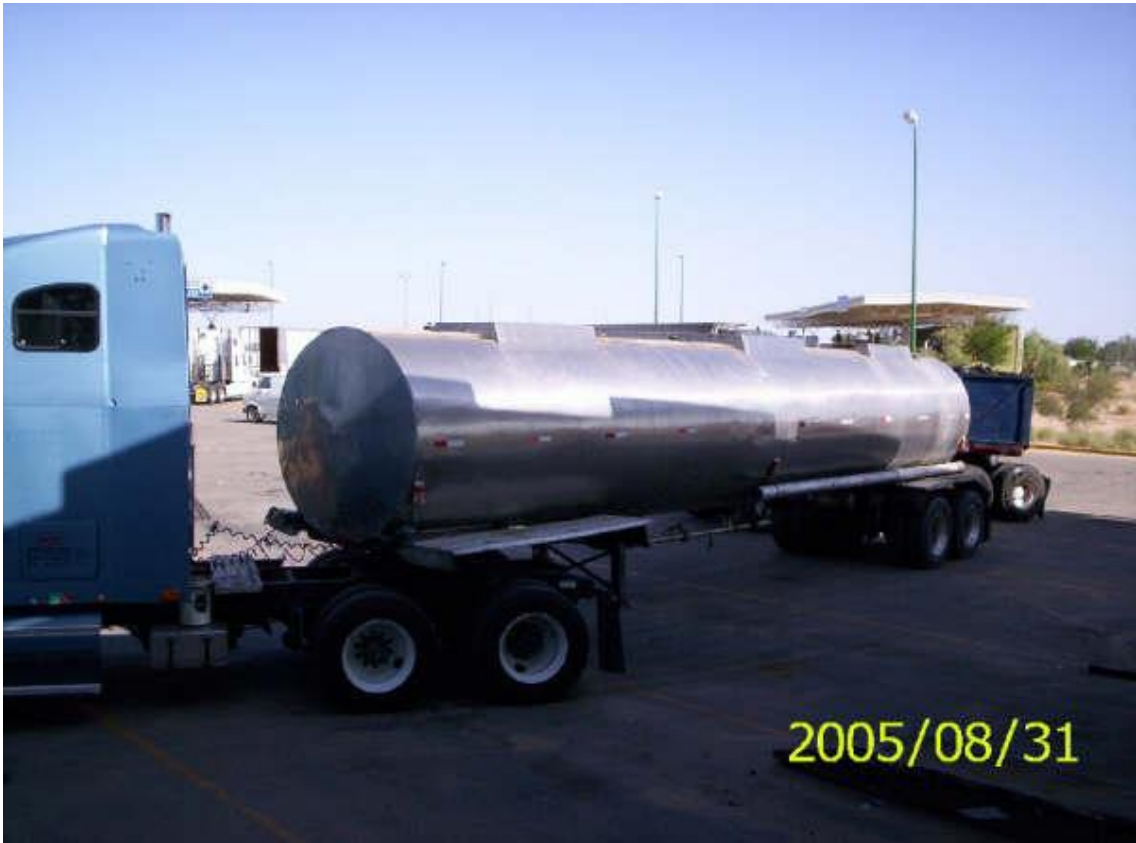
Contenedores de líquidos o productos químicos