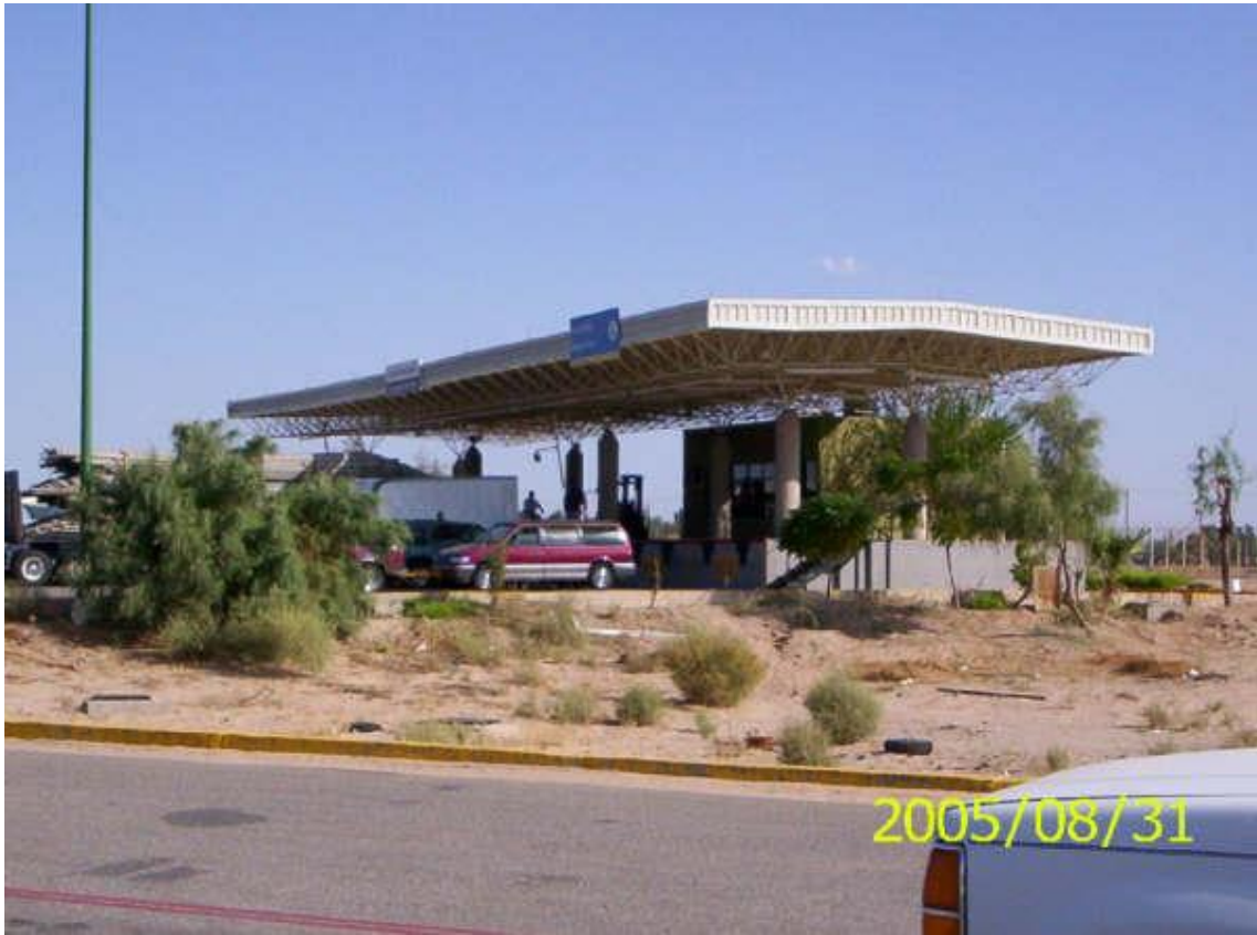
Plataforma de segundo reconocimiento