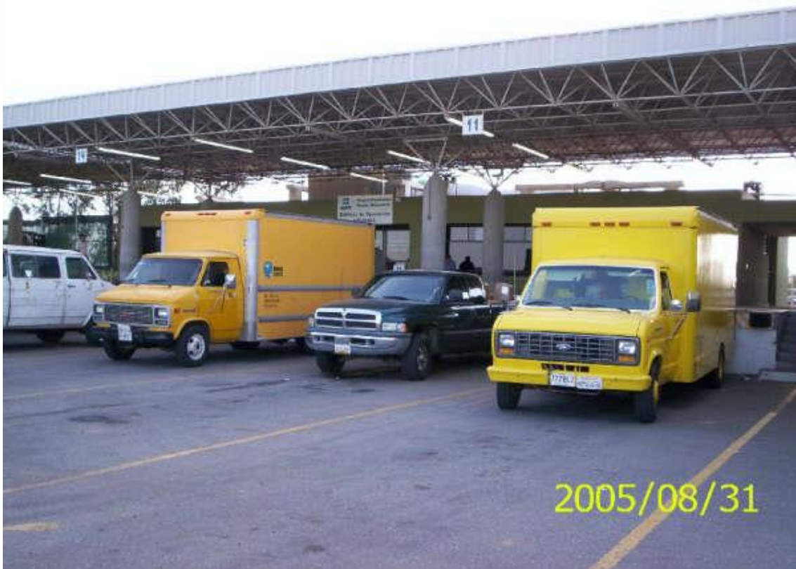
Cajones de Reconocimiento Aduanero en el área de importación