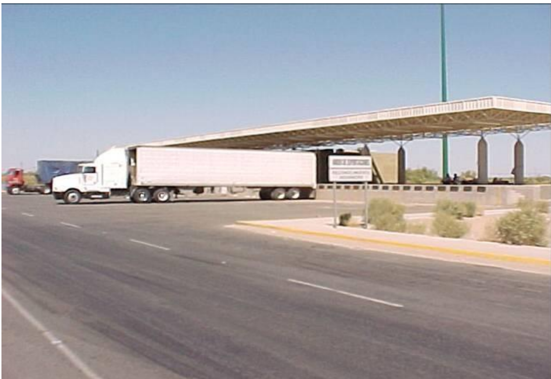
Cajones y Plataforma de Reconocimiento en el área de exportación