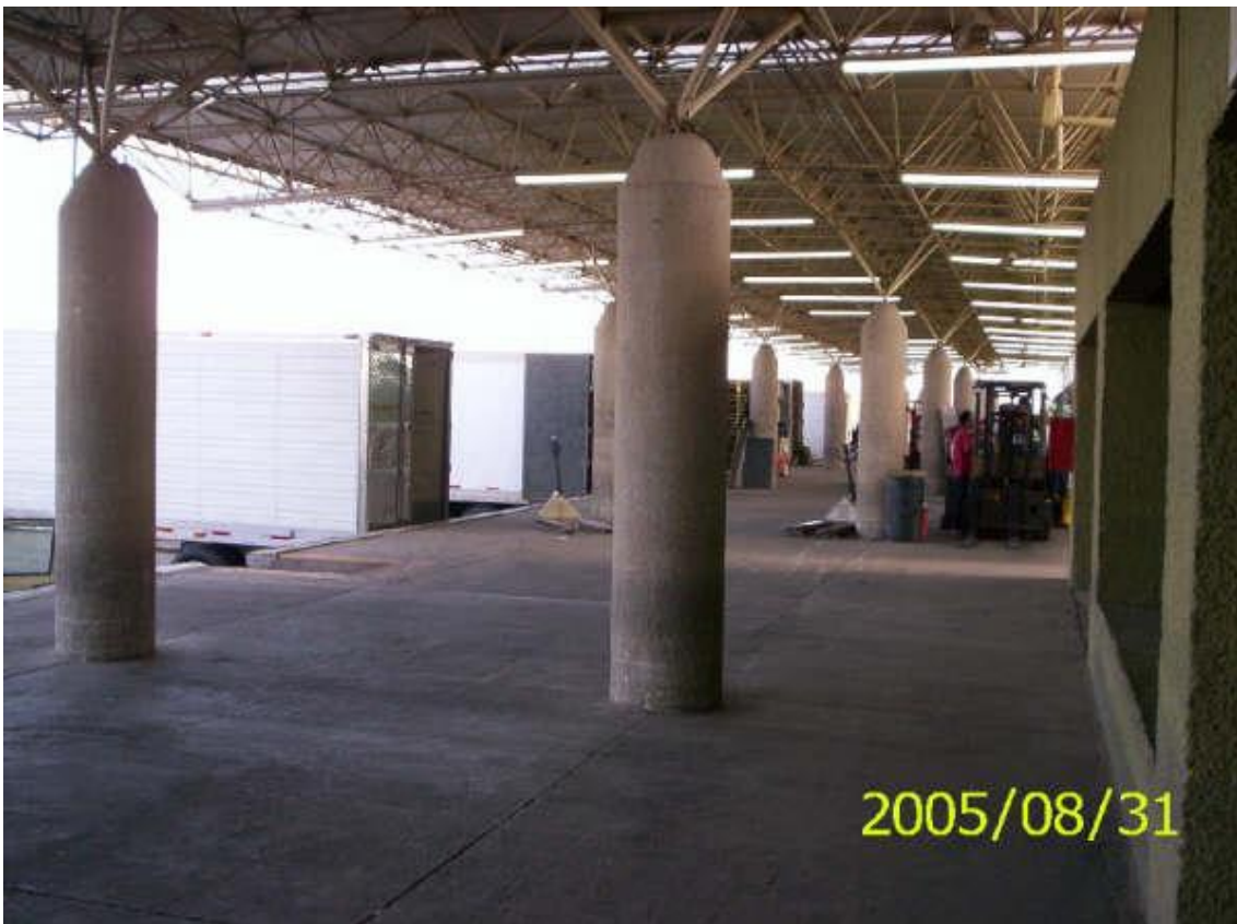
Plataforma de Reconocimiento Aduanero en el área de importación