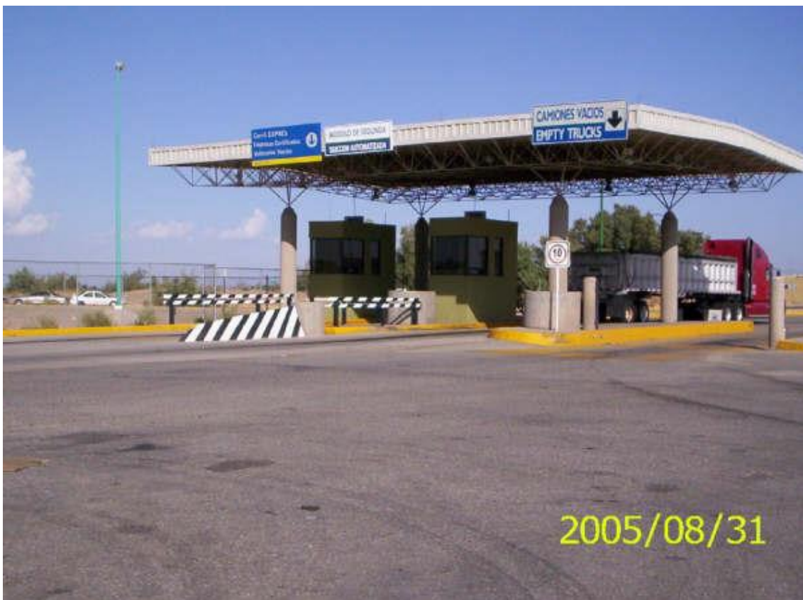
Módulos de selección automatizada de segundo reconocimiento