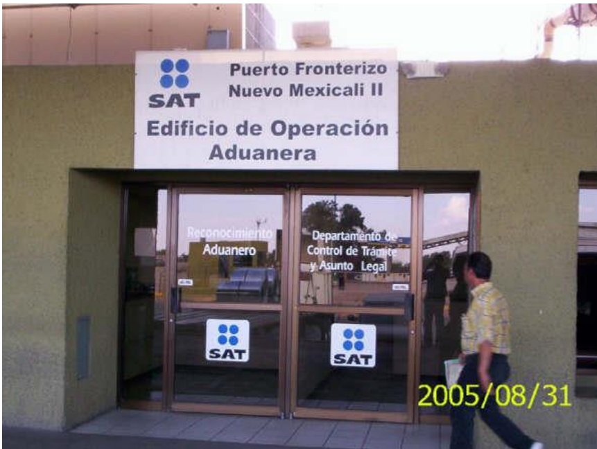
Departamento de Operación Aduanera