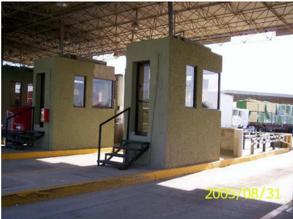
Modulos de selección automatizada para Importación de mercancías