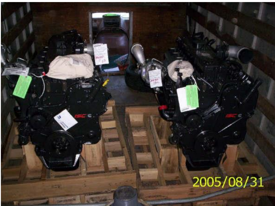
Motores de combustion