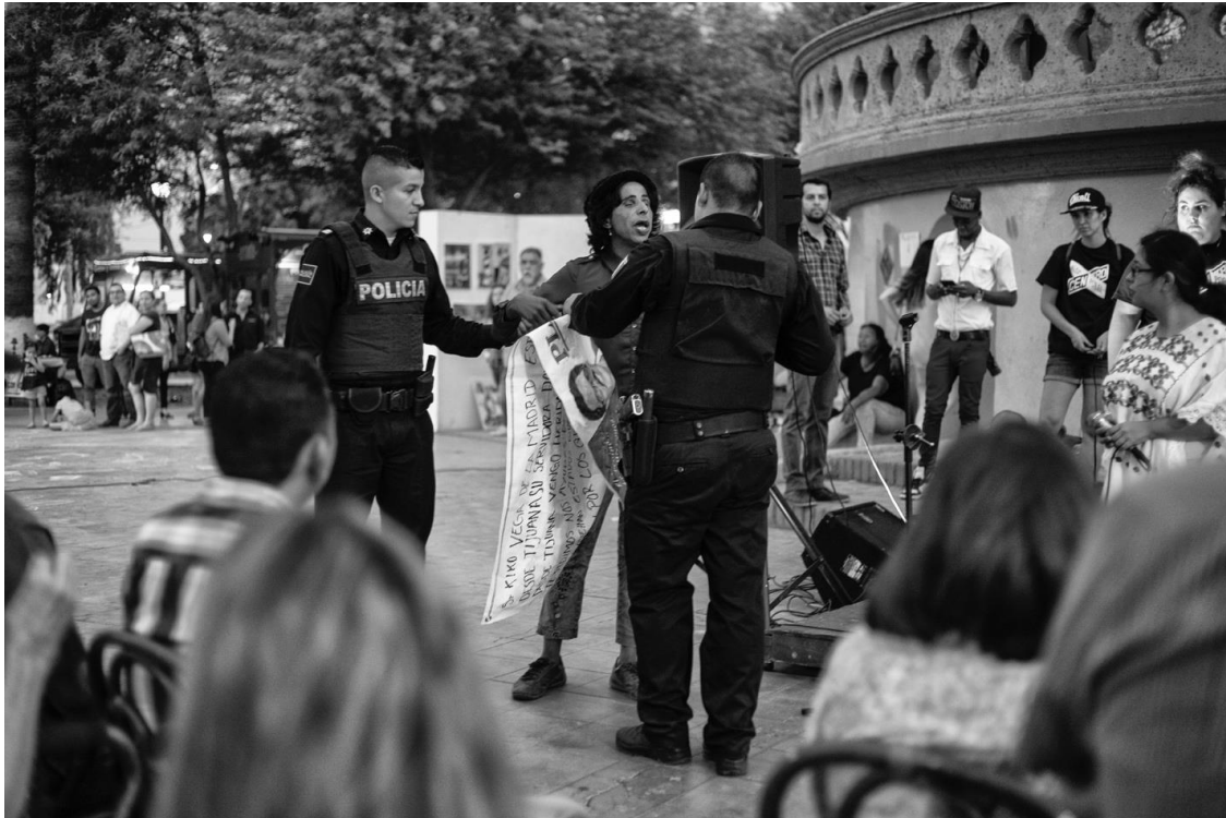
Figura 76. Momento en que dos policías interrumpen al joven de la calle para llevárselo a la patrulla. 10 de junio de 2017.