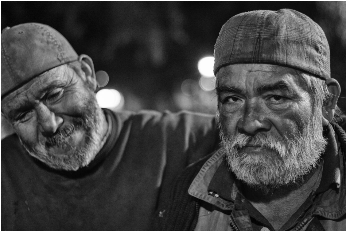
Figura 26. Retrato de dos hombres que no me dijeron sus nombres. Cuando vieron su foto a través del visor de la cámara, uno de ellos afirmó: “parecemos gemelos”. Enero 24 de 2016.