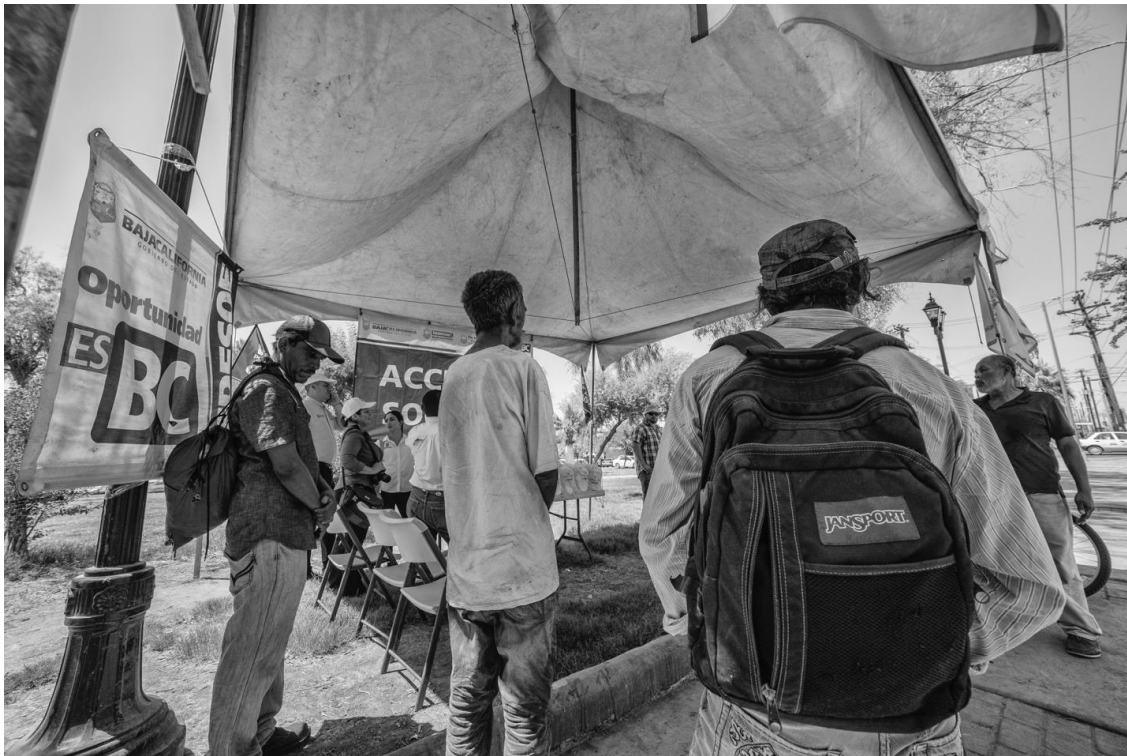
Figura 35. Hombres y mujeres esperan que personal de la SEDESOE les entreguen bolsas que contienen sueros, gorras y botellas que les ayuden a mitigar la época de calor en la ciudad.