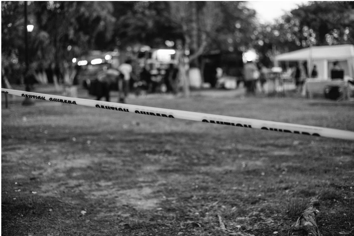
Figura 78. Detalle del acordonamiento que realizó la policía en todo el perímetro del parque. 10 de junio de 2017.