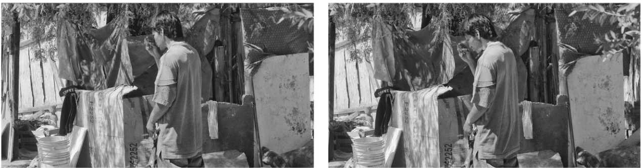
Figura 1 y 2. Fotogramas del video tomado al “McDonald’s” mientras revisaba su rostro golpeado en un espejo. 27 de mayo de 2017.

Durante las horas que duró la golpiza no hizo otra cosa más que rogar por que lo dejaran de atormentar, y repitió incansablemente que podía ayudarles a buscar a los responsables si lo dejaban ir. Desnudo sobre la carretera, el “McDonald’s” fue abandonado. Pidió ayuda, alguien le prestó algunas prendas. Y siguió caminando solo, hasta llegar a “su casa”.