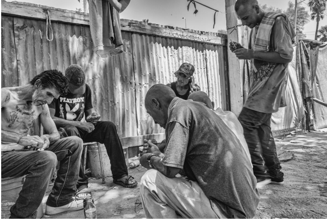
Figura 54. Un grupo de hombres en el momento en que consumen heroína. 7 de agosto de 2017.