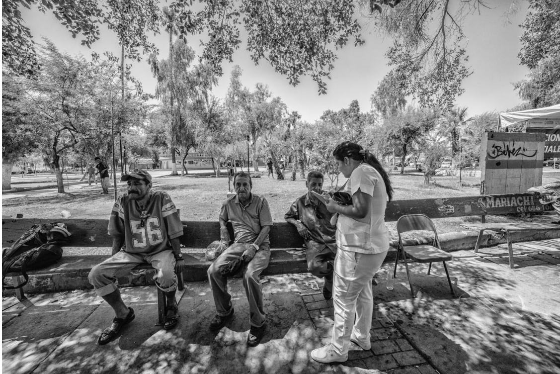
Figura 34. Enfermera toma los datos de los hombres que hacen fila para ser atendidos en la unidad móvil “De la mano contigo” de la SEDESOE.