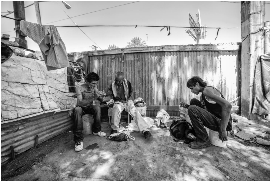
Figura 55. 7 de agosto de 2017. Tres hombres del grupo después de haberse “curado”, es decir, de haberse inyectado.