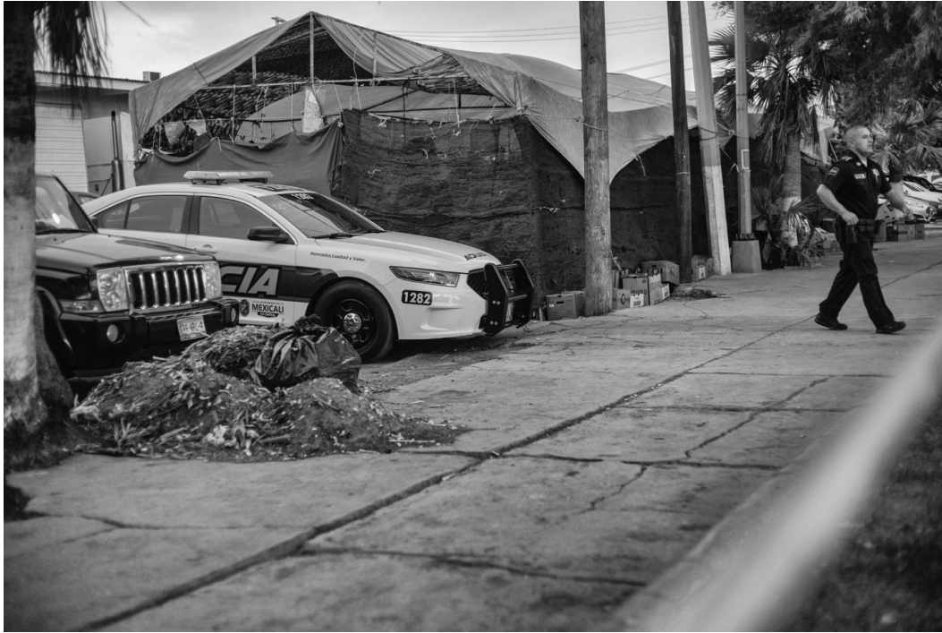
Figura 75. Presencia de la policía municipal en el evento ¿“Par qué quieres un parque?” organizado por la A.C. Algo por el Centro en el Parque del Mariachi. 10 de junio de 2017.