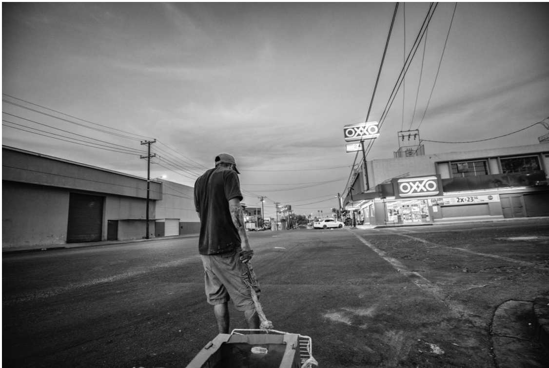
Figura 73. En ese momento trae una infección en el brazo que buscaba curarse. 25 de julio de 2018.