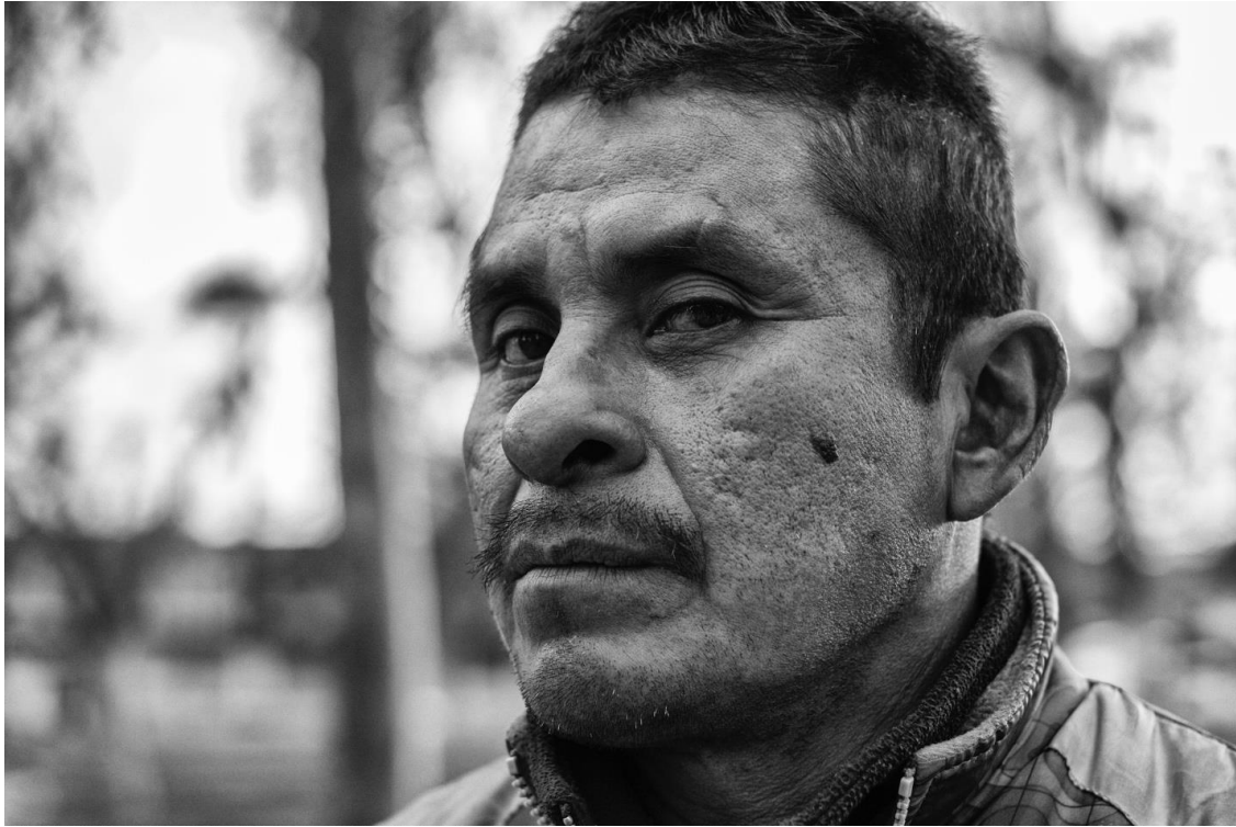
Figura 31. Retrato del “Jarocho”. Enero 23 de 2016