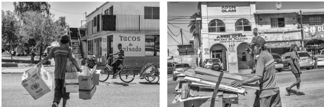
Figura 7. Izq. Oscar se dirige hacia su carriola para depositar el cartón que recolectó del suelo. Der. Oscar frente al Parque del Mariachi platica conmigo mientras acomoda el cartón. Detrás de él pasa una de las indigentes más longevas de la zona. 17 de mayo de 2017.