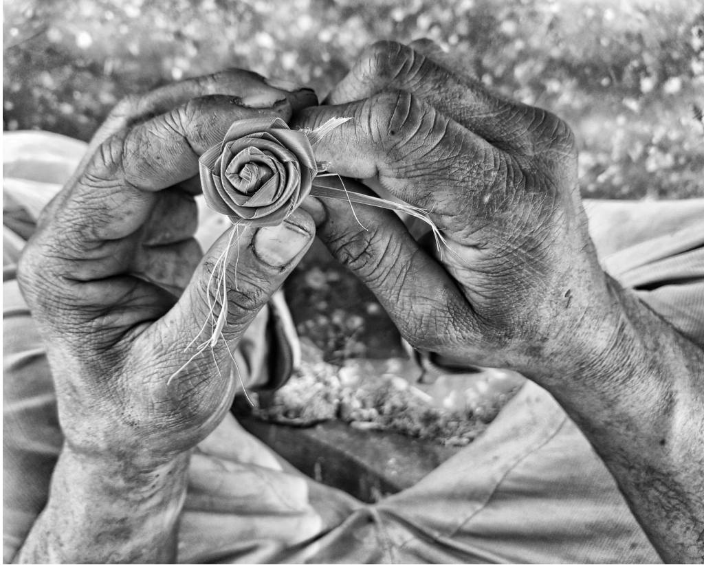
Figura 71. Detalle de flor de hoja de palma elaborada por Alejandro, uno de mis colaboradores. 19 de febrero de 2018.