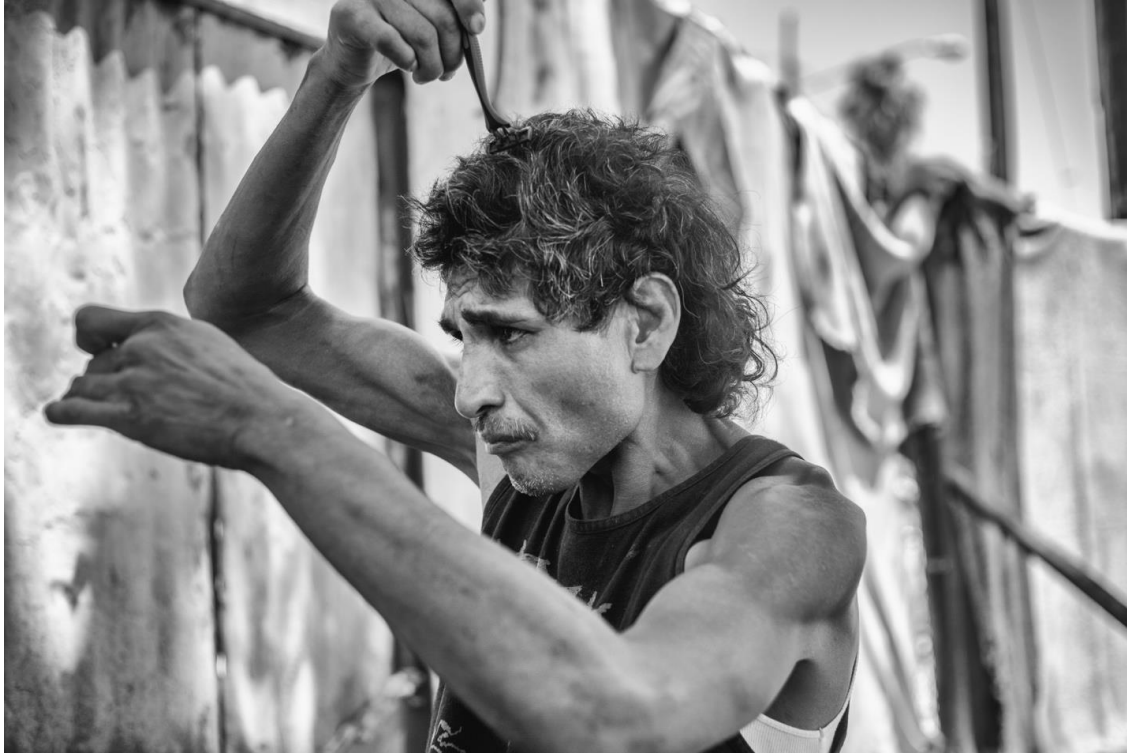
Figura 58. “El Foca” se peina con un rastrillo. 7 de agosto de 2017.