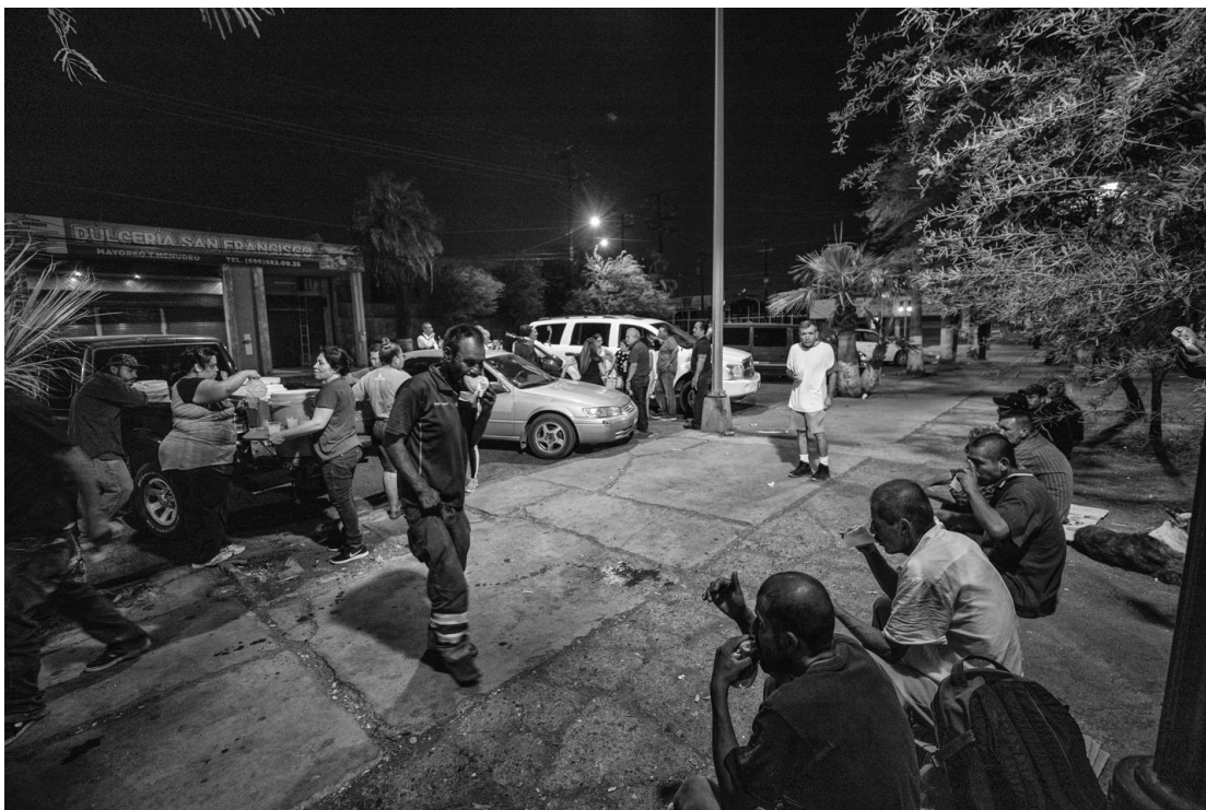
Figura 19. Aspecto del momento en que grupos de la sociedad civil y religiosos ofrecen alimentos a la gente del parque. 7 de agosto de 2018