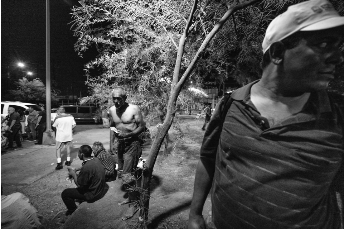
Figura 18. Aspecto del momento en que grupos religiosos y de la sociedad civil ofrecen alimentos a la gente del parque. 7 de agosto de 2018.