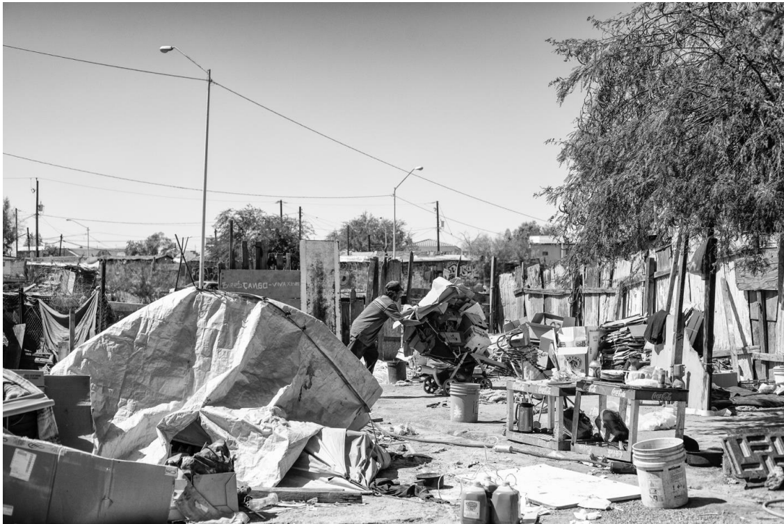
Figura 47. Oscar llega a su casa, el yongo donde vive y acomoda la carriola con cartones.