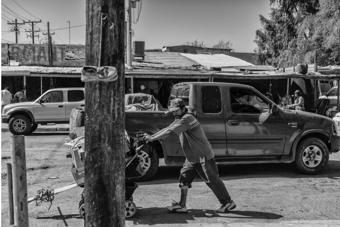
Figura 44.. Oscar camina frente al mercado Braulio Maldonado después de lograr vender unas cajas de cartón.