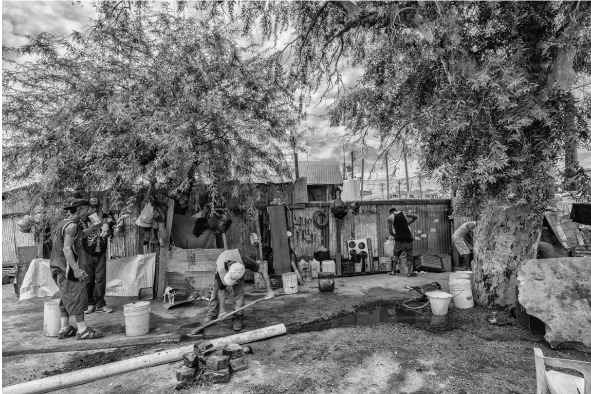
Figura 49. Aspecto del yongo durante una tarde de verano. 31 de julio de 2017.

Las siguientes imágenes muestran aspectos generales del paisaje del yongo que tuve la oportunidad de visitar. Me interesa que pueda apreciarse la dinámica del lugar, la cantidad de gente que lo visita, las necesidades fisiológicas, de consumo, de acompañamiento y convivencia entre ellos y en su relación con los animales.