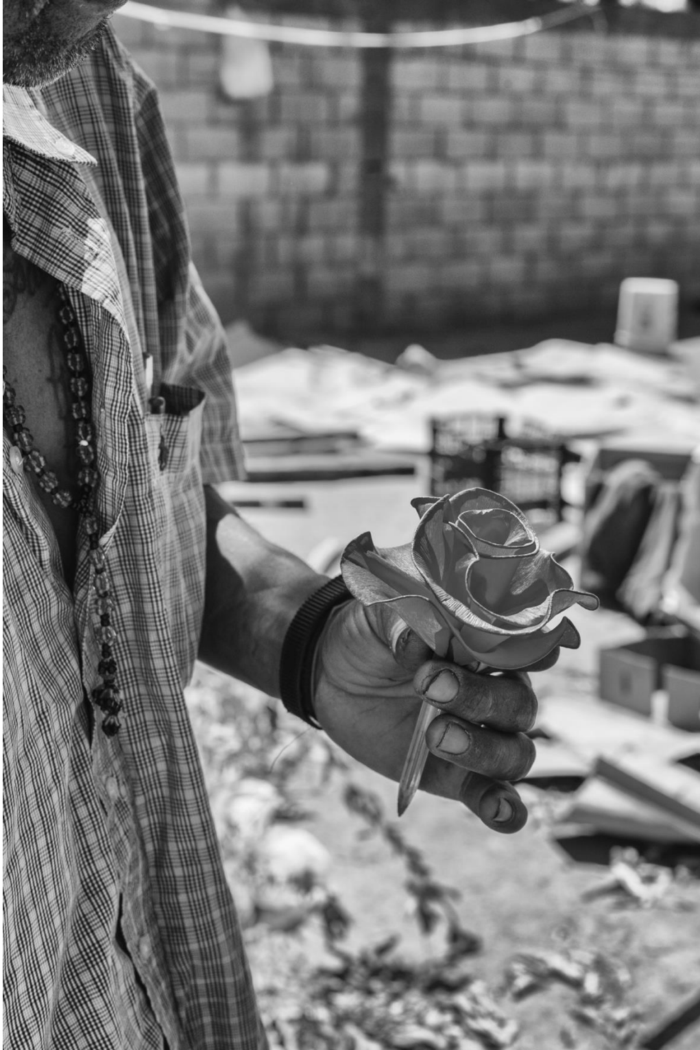
Figura 69. Flor de papel en una pluma. 27 de mayo de 2017.