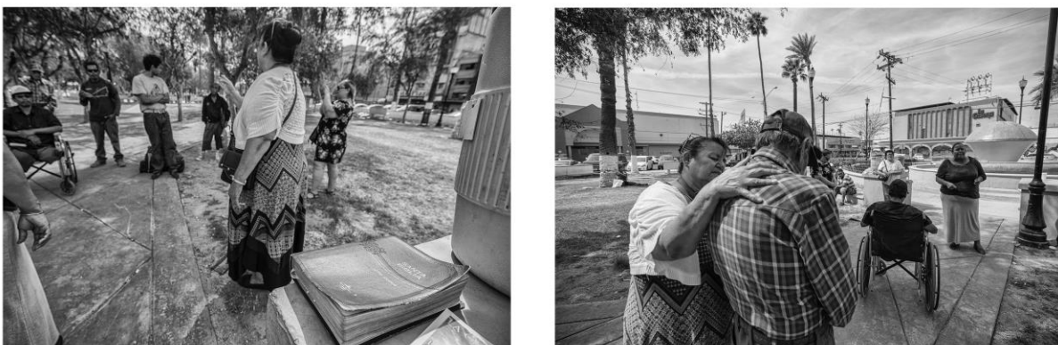
Figura 11. El parque Niños Héroes de Chapultepec, mejor conocido como el Parque de la Línea por su ubicación frente al límite territorial entre Mexicali y Calexico, es visitado regularmente por grupos religiosos que predicán la palabra y que ofrecen alimento a quienes se encuentran en una situación de precariedad y vulnerabilidad como lo son quienes usualmente visitan este lugar: deportados de los Estados Unidos, indigentes, centroamericanos que buscan cruzar al otro lado. 4 de abril de 2018.