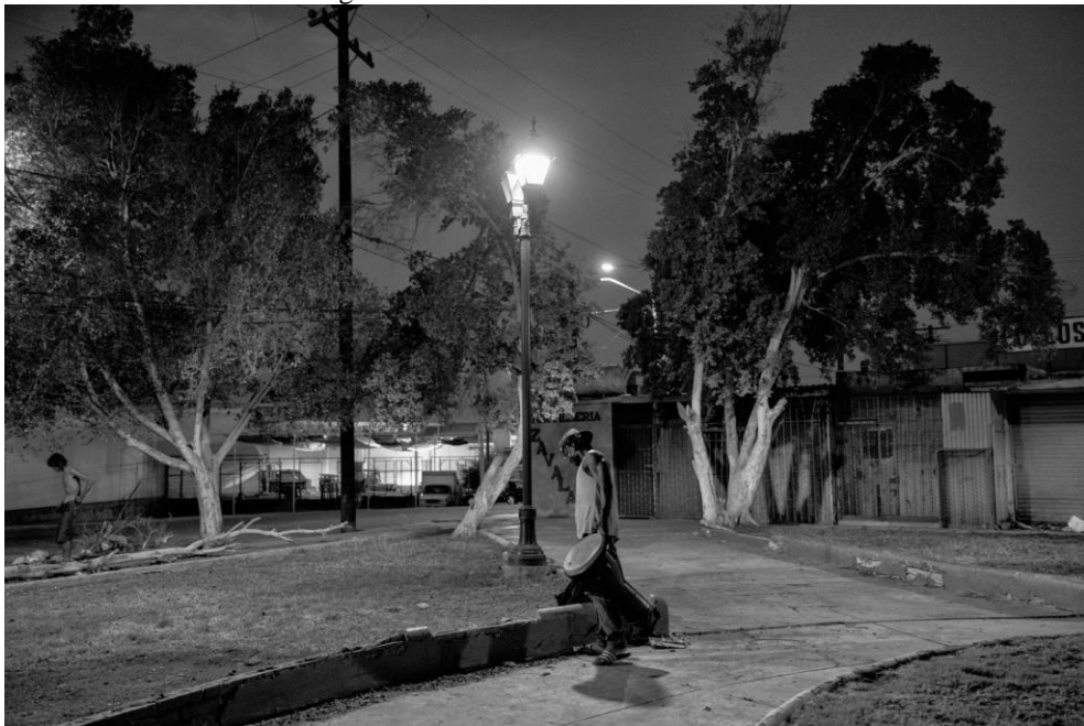
Figura 15. Aspecto nocturno del parque mientras Alexander, joven originario de la zona garífona de Honduras, recoge su mochila y carga un djembe . Al fondo del lado izquierdo se alcanza a ver a un hombre sin camiseta que se acomodaba los shorts. 27 de julio de 2018.