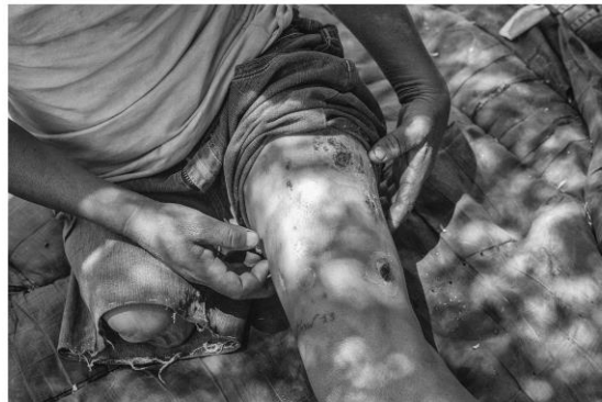
Figura 9. (Izq) Detalle de la mezcla de heroína y cristal depositada en una cuchara de plástico mientras la aguja se introduce. (Der.) Detalle de la pierna lastimada de Nancy por los cuerazos . 17 de mayo de 2017.