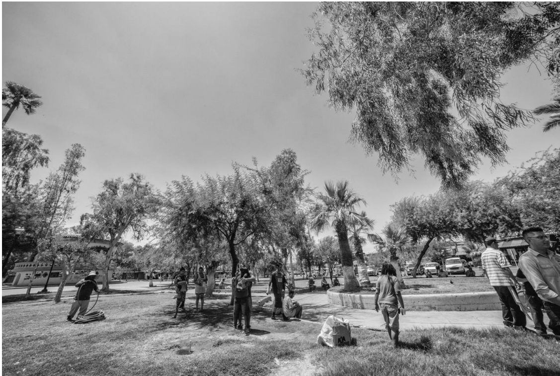
Figura 39. Una vez que recibieron los alimentos, la gente se dispersa en el parque.