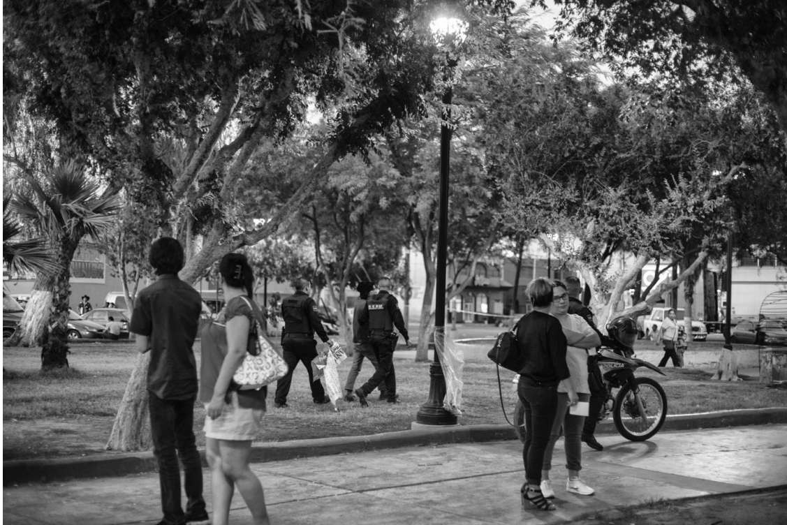
Figura 77. Policías encaminan al joven indigente a la patrulla. 10 junio de 2017.