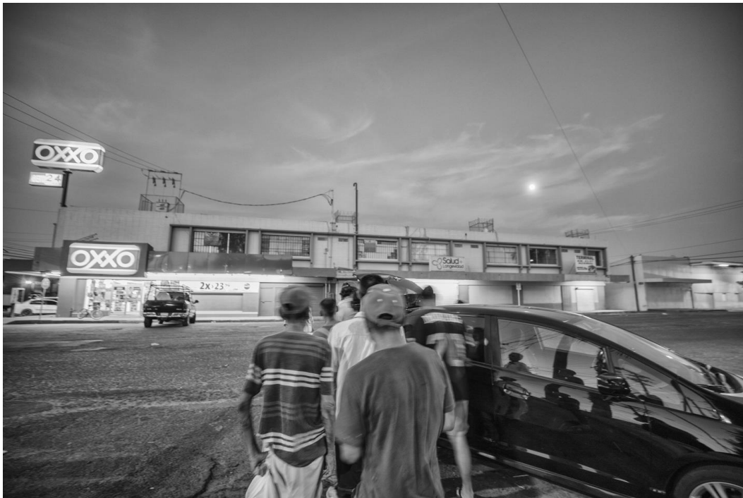
Figura 74. Mientras estoy fotografiando a Noé, llegan dos jóvenes que traían sándwiches y sodas para la gente del parque. Noé hace fila. 25 de julio de 2018.