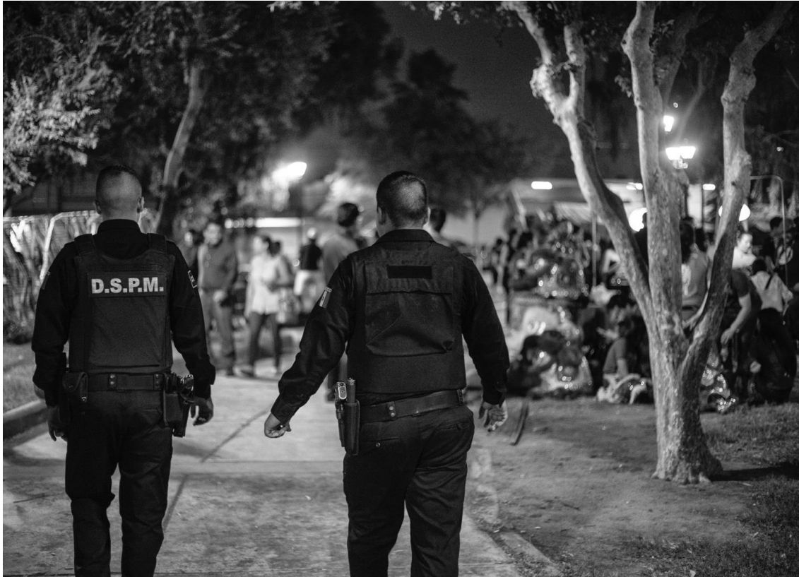
Figura 79. Policías.10 de junio de 2017.