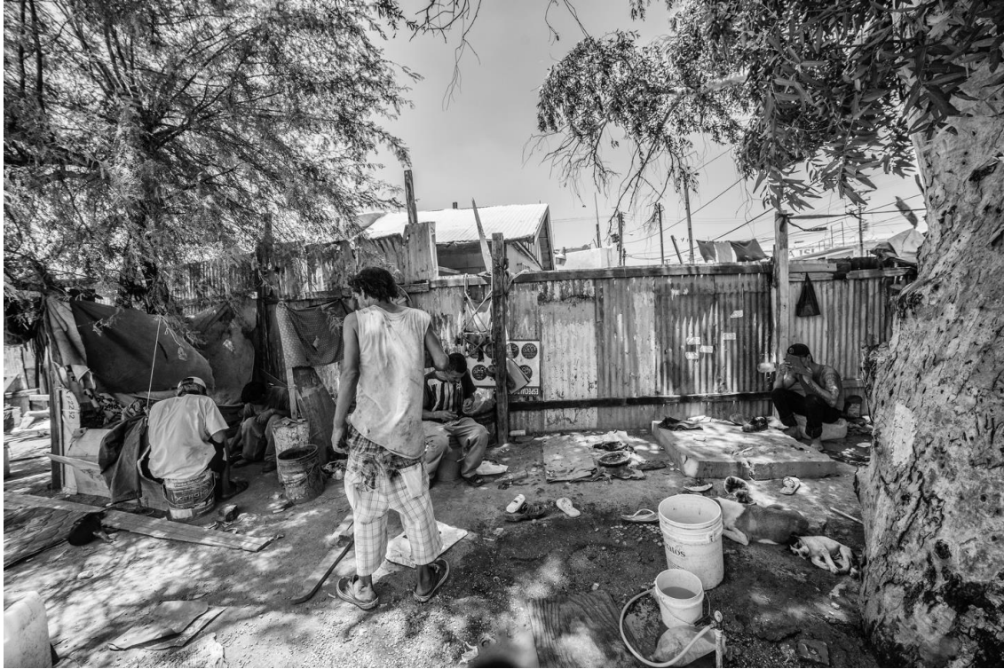
Figura 50. Aspecto del yongo durante una tarde verano. Julio 18 de 2017