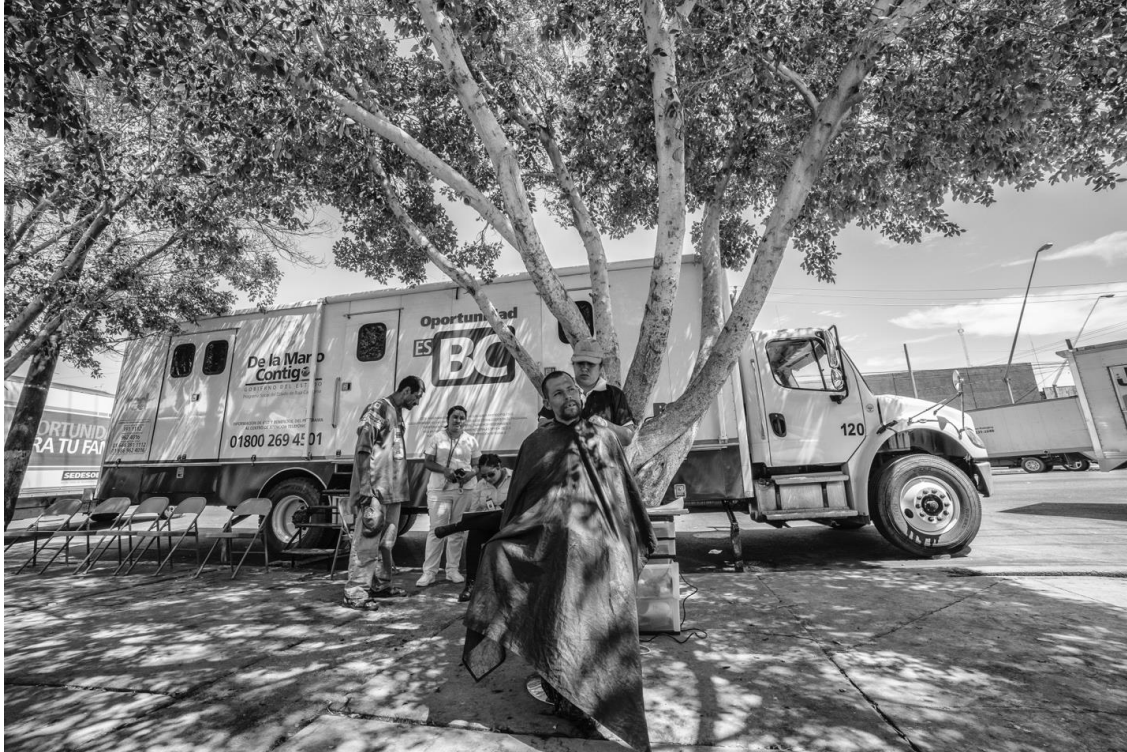
Figura 32. Una mujer que participa del proyecto social de la SEDESOL “De la mano contigo” le corta el cabello a uno de los hombres del Parque de I Mariachi.