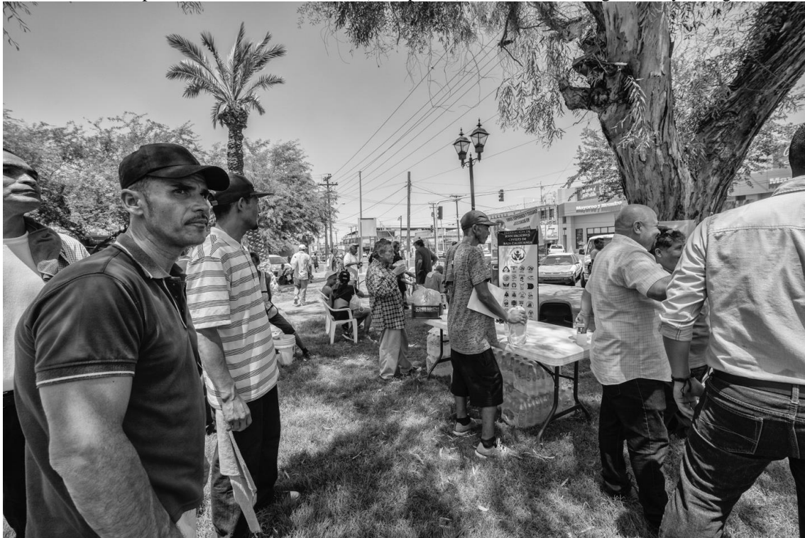
Figura 37. Hombres pertenecientes a diferentes centros de rehabilitación cuidan el orden del evento.