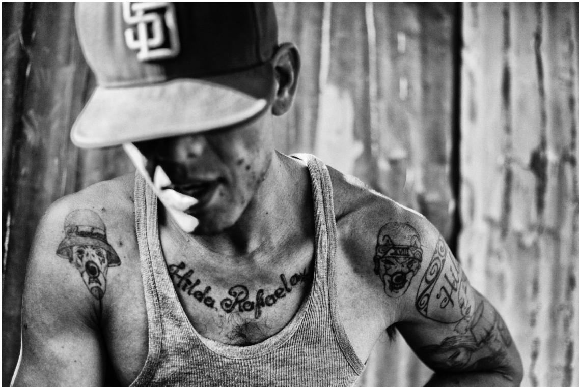
Figura 57. Retrato del Pulpo. Julio 18 de 2017.