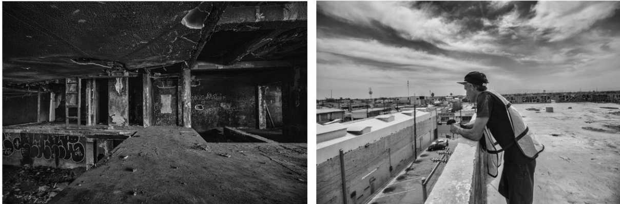
Figura 13. (Izq.) Detalle del interior del Mercado El Ahorro convertido en yongo , en donde se aprecian las ruinas quemadas consecuencia del incendio que sufrió el lugar en la década de los noventa. (Der.) El Güero observa su ciudad natal, Mexicali, desde el techo de las ruinas del Mercado El Ahorro. 4 de abril 2018.