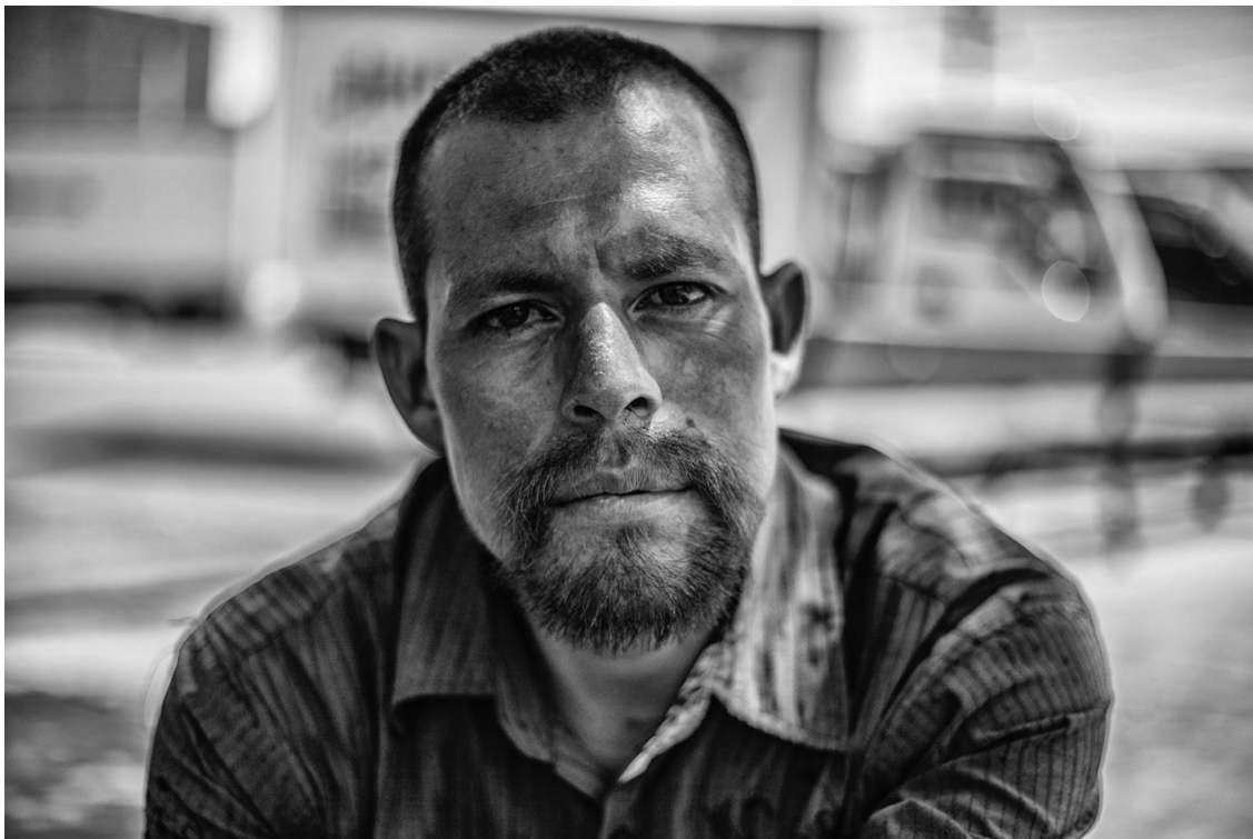
Figura 33. Retrato a hombre del parque al finalizar el corte de cabello