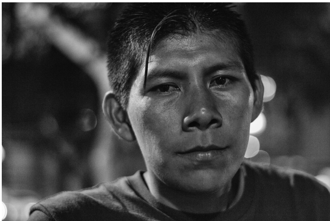
Figura 28. Retrato de joven campesino. Junio 10 de 2015.