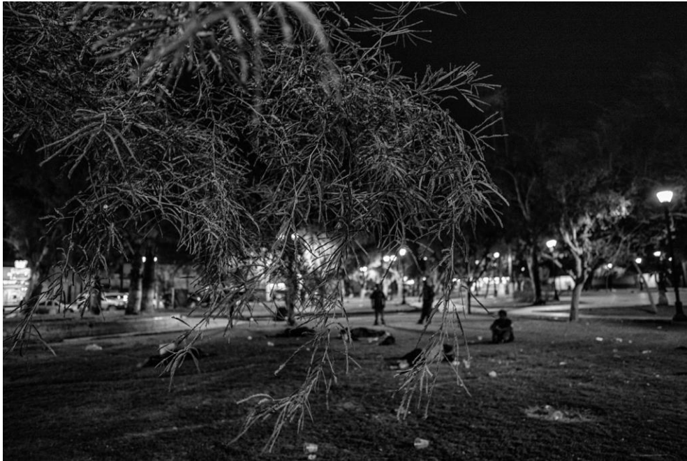
Figura 14. Aspecto nocturno del parque. Un grupo de hombres yacen sobre el jardín en una noche de verano. 7 de agosto de 2018.