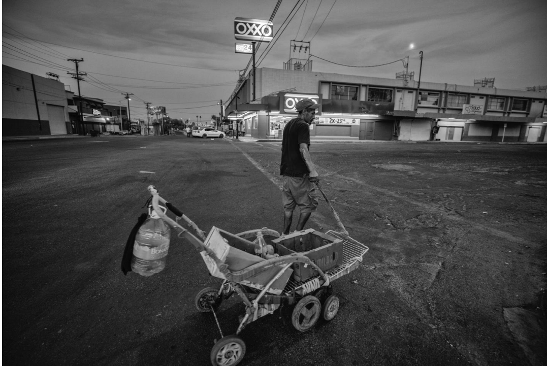
Figura 72. Noé sobre la calle frente al Oxxo que se encuentra en contra esquina del parque. Noé carga un carro con merma que había conseguido en el mercado Braulio Maldonado y que buscaba revender.