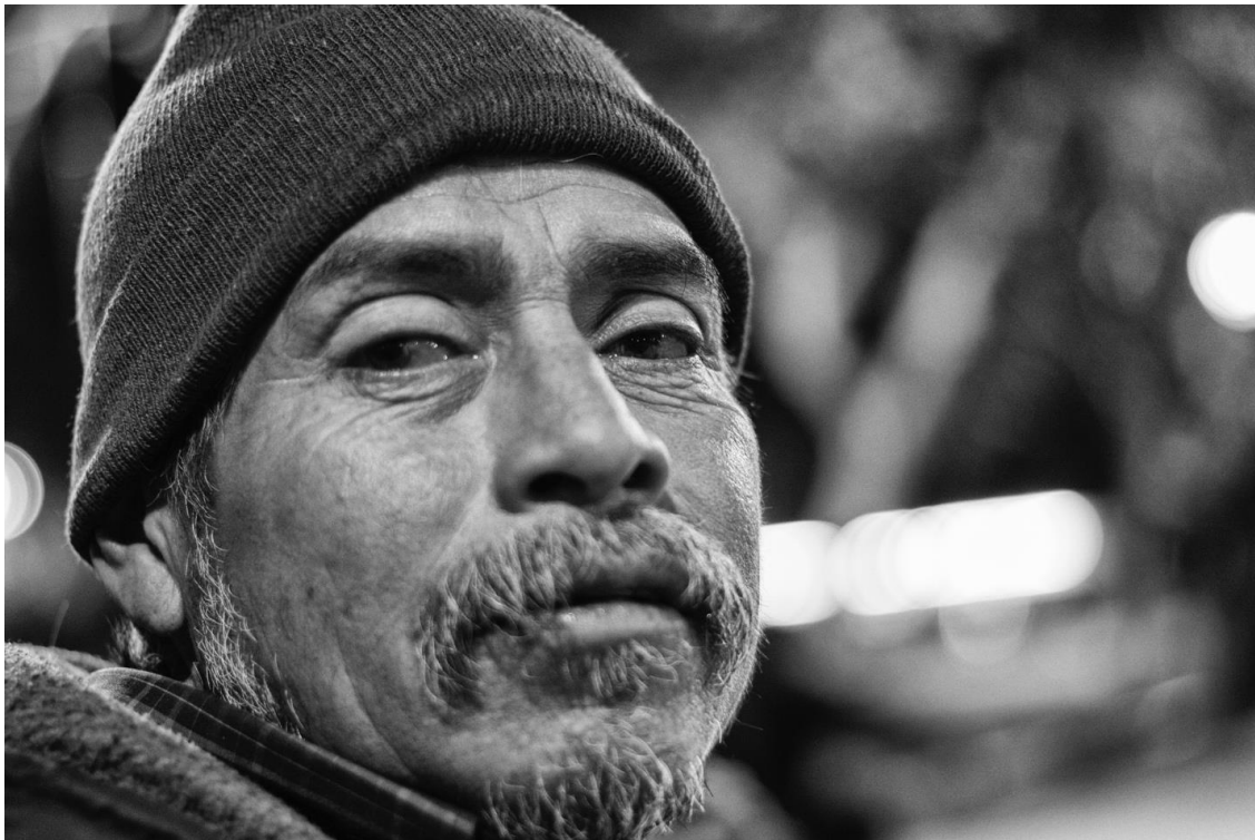
Figura 30. Retrato de hombre deportado. Enero 3 de 2016.