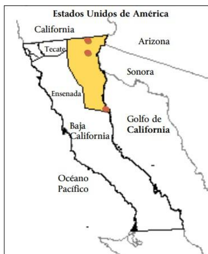
Figura 1. Localización del municipio de Mexicali