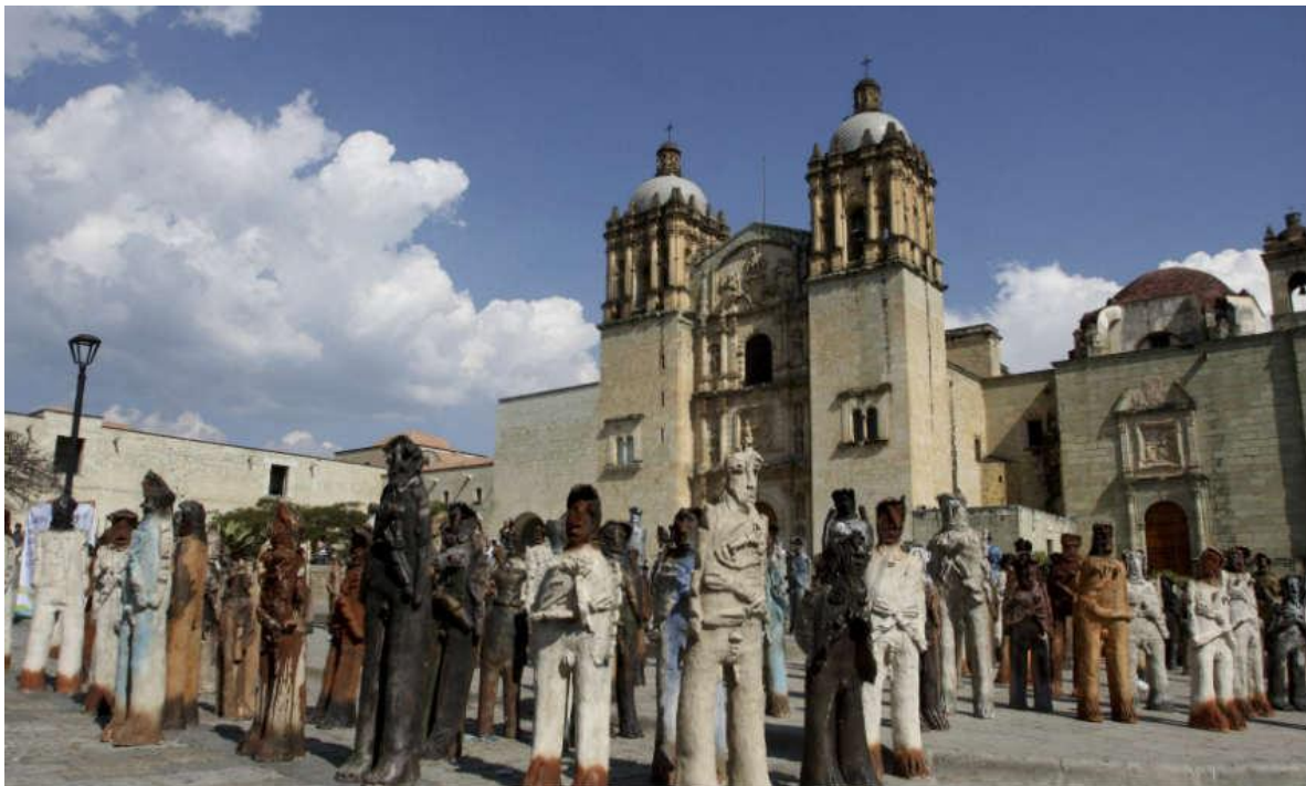
'' 2051 migrantes, Oaxaca 2007''

las cruces, que estimo en unas 2500, la guardó en su mente y por cada cruz realizo la figura de un migrante hecho barro. Dijo que decidió añadir una figura más, la 2.501, para simbolizar que siempre hay una persona más de las que se sabe que intentan llegar a Estados Unidos.