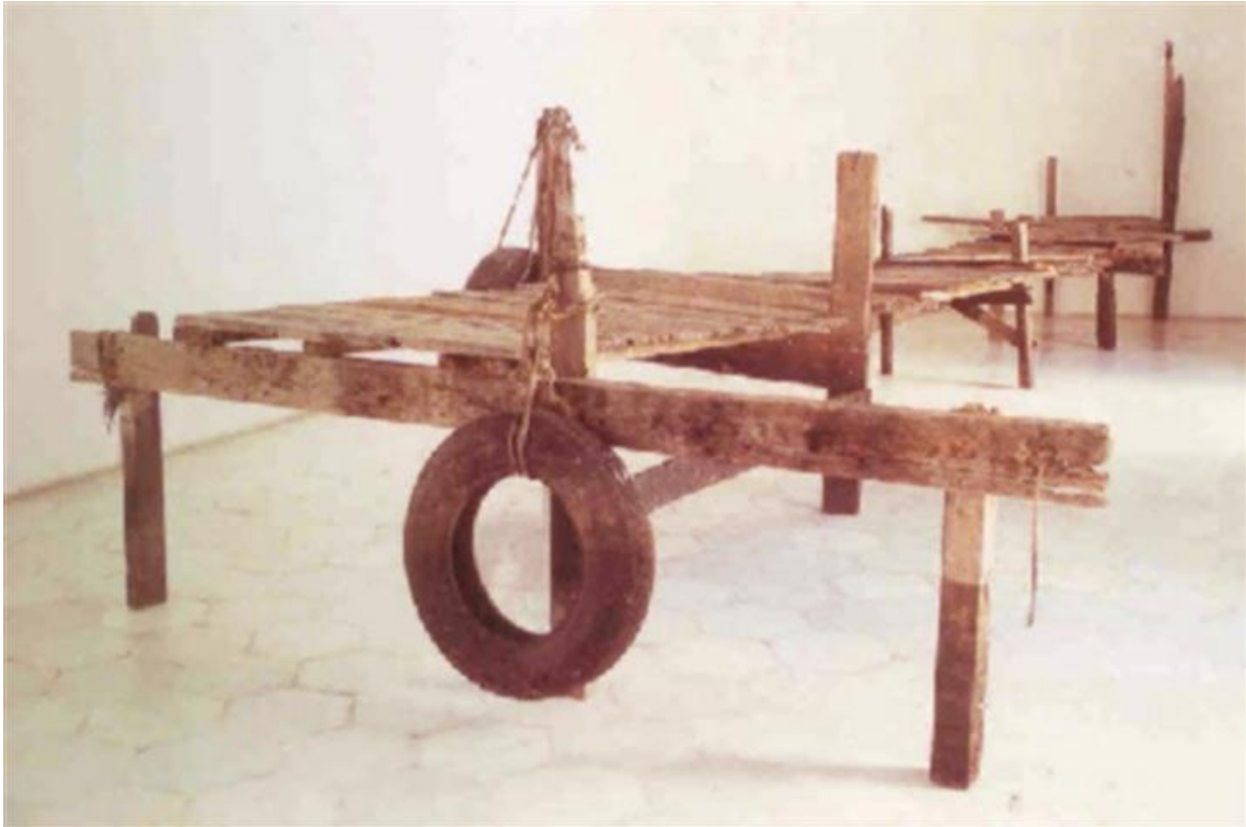
''El camino de la nostalgia, 1995, Instalación''