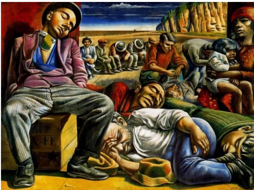
''Antonio Berni, Desocupados , 1934. Óleo sobre arpillera, 218 x 310 cm.