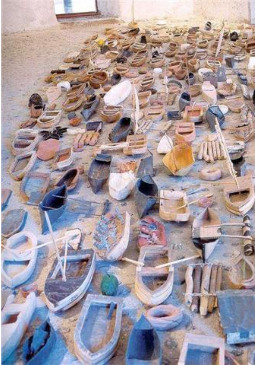
''Regata, 1994 Instalación de de barcos de madera y objetos varios con medidas variables. IV Bienal de La Habana, Castillo del Morro''