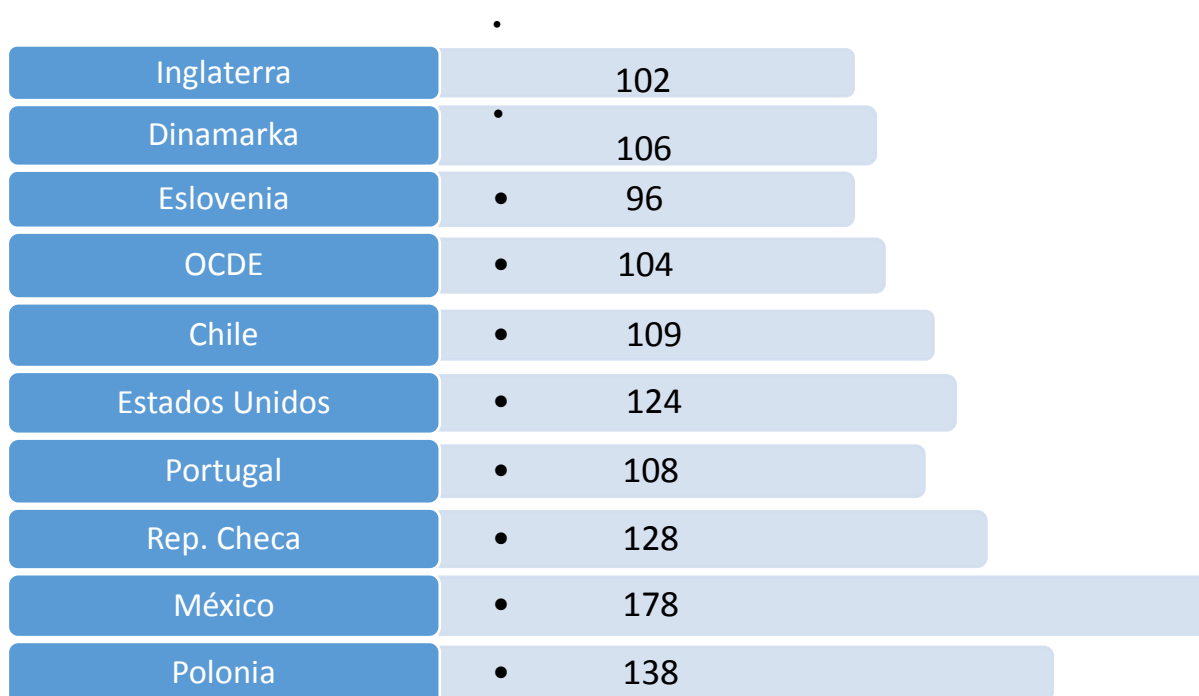
Ilustración 3 Muerte tratable países OCDE 2007