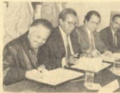
Lechuga, gobernador del estado y procurador general de la República, respectivamente.

Con el fin de realizar acciones y proyectos relativos a la formación de recursos humanos, investigación y extensión en materia de ciencias penales, la Secretaría de Educación Pública (SEP), el Instituto Nacional de Ciencias Penales (INACIPE) y la Universidad Autónoma de Baja California firmaron, el pasado 4 de febrero, un convenio para implementar un programa de formación profesional continua. Fungieron como testigos de honor los licenciados Ernesto Ruffo Appel e Ignacio Morales