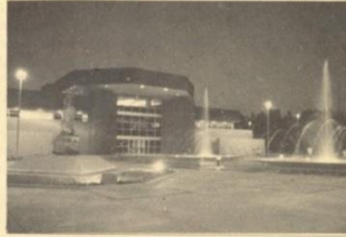
Treinta y cinco años de avance y desarrollo. 35 años por la realización plena del hombre. Centro de productividad y desarrollo tecnológico, en la Unidad Enseñada, y edificio de Investigación y Posgrado, en Mexicali.