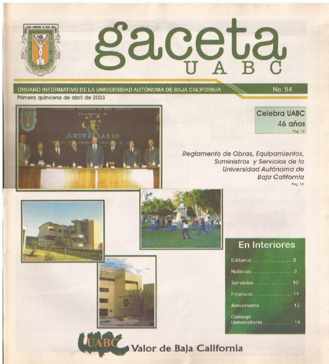
Imagen 8. Portada de Gaceta UABC publicada durante el periodo rectoral de Alejandro Mungaray Lagarda. Gaceta No. 94, abril 2003.

Además de eso, al ser la institución consiente del crecimiento de la universidad en infraestructura y población estudiantil, durante la gestión de Alejandro Mungaray, la gaceta cambió la periodicidad, dejando de ser mensual pasa a convertirse en una publicación catorcenal. Esto habla de que el número de colaboradores en las distintas regiones del