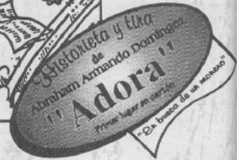
Imagen 6. Sección de caricaturas. Gaceta No. 36, febrero 1996, página 44.