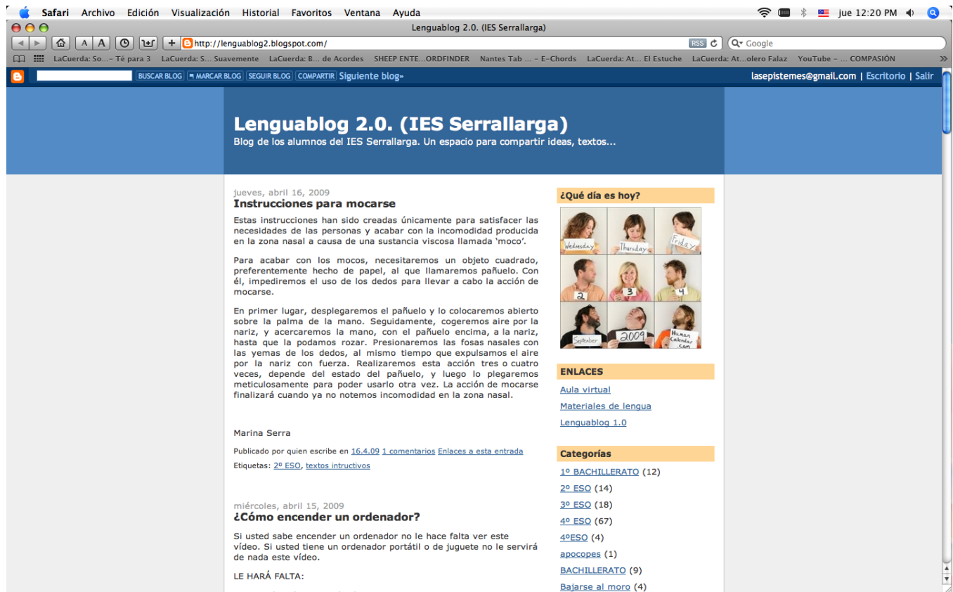
Figura 3 Imagen de blog de estudiante de bachillerato

nuevos alumnos de bachillerato. En este blog no encontramos la publicación de tareas escolares, pero es importante ver que se abrió por iniciativa de uno de los estudiantes quien invitó a otros a participar. Esto afirma el carácter social de los blogs mencionado por los autores especializados.