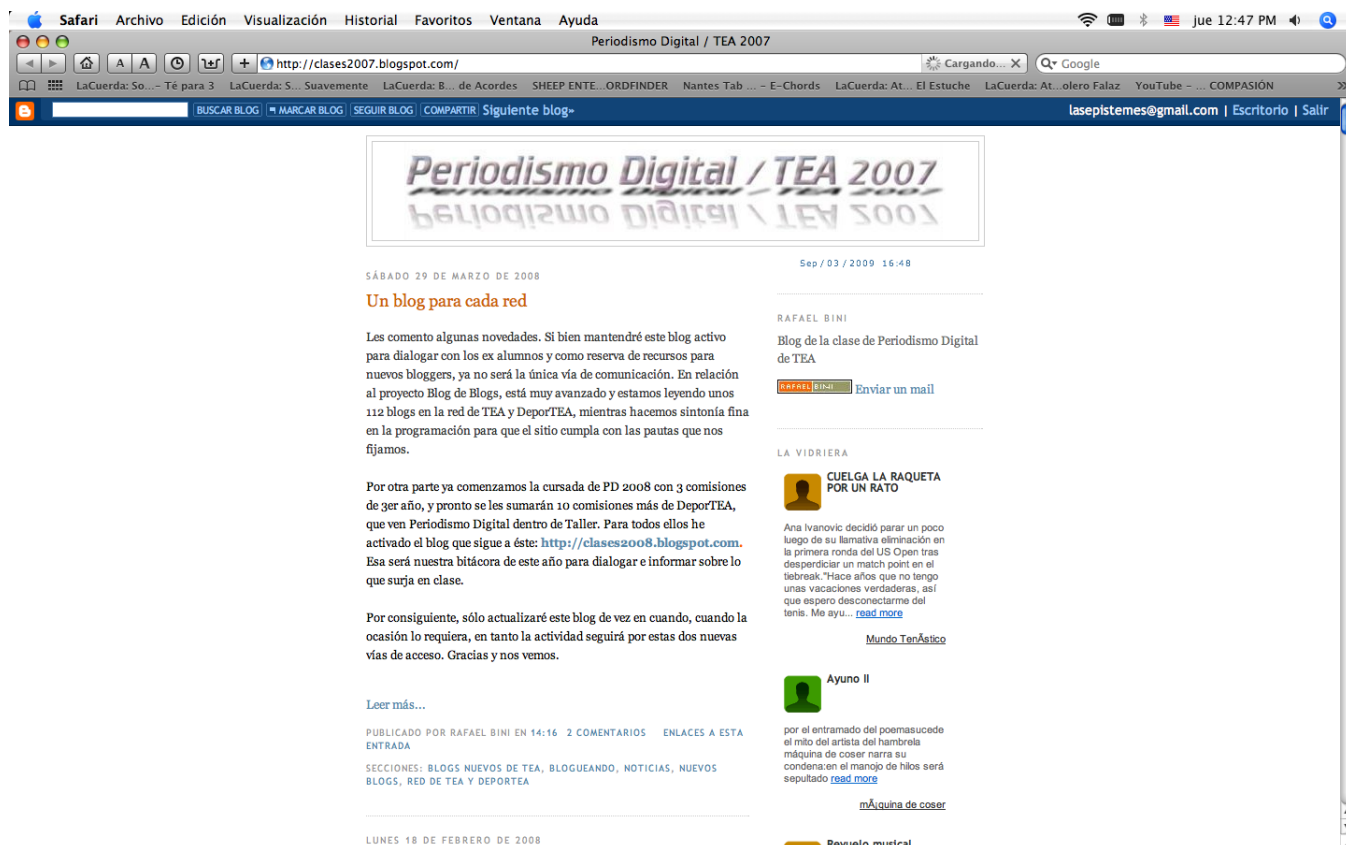
Figura 5 Imagen de blog de profesor de universidad

En particular podemos destacar el ejemplo del blog de profesor universitario, donde se observa gran actividad en publicaciones y comentarios, el uso de recursos digitales disponibles y la presencia de ligas hacia periódicos en línea y los blogs de estudiantes. Cabe mencionar que este blog era usado dentro de la materia de periodismo digital en la carrera de comunicación.