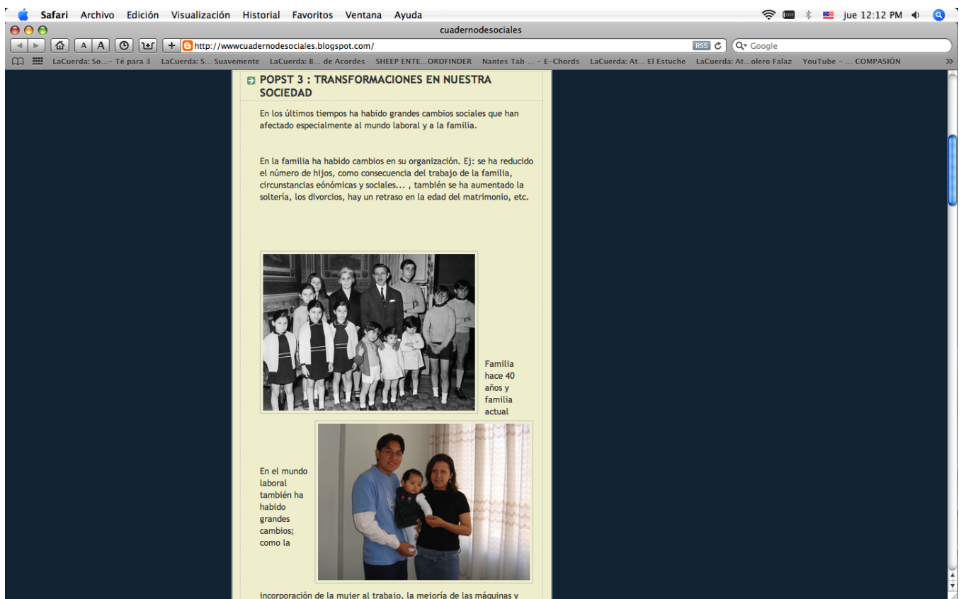
Figura 2 Imagen de blog de estudiante de secundaria

El blog de estudiantes de secundaria es colectivo y además utilizado por estudiantes de dos niveles distintos de secundaria. Dicho blog es administrado por el profesor de la materia y tiene como objetivo el debate de las ideas relacionadas con la materia de ciencias sociales. Esto reafirma lo mencionado por los autores sobre el potencial de los blogs para fomentar el debate escrito. En este blog se encontraron una gran cantidad de comentarios, que según los expertos es una característica muy importante de los blogs.