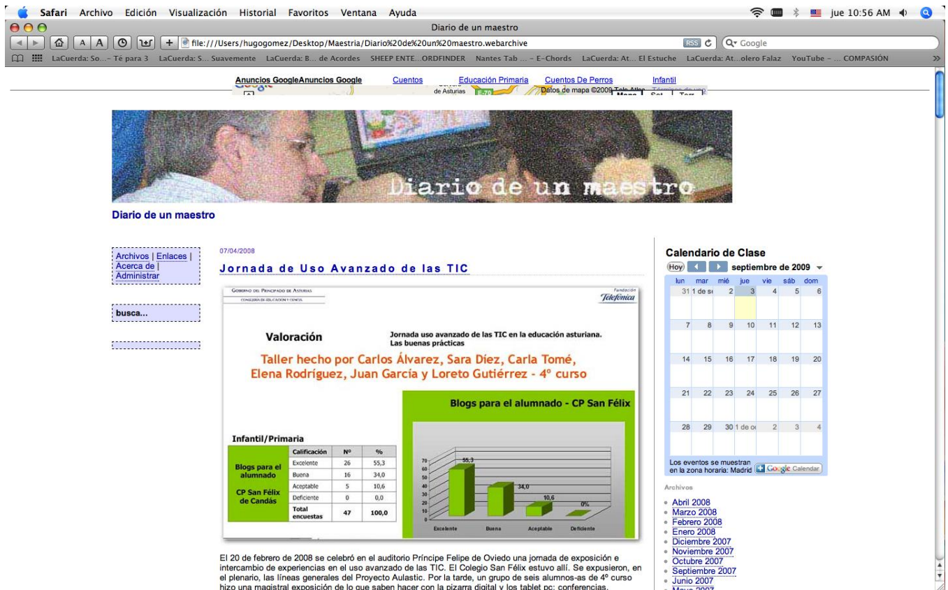
Figura 4 Imagen de blog de profesor de primaria

El planteamiento de Nardi, Schiano y Gumbrecht (2004) respecto a que los blogs se usan para crear comunidades virtuales, donde se discuten ideas y se expresan opiniones se confirma en los blogs educativos estudiados. El caso más representativo lo encontramos en los blogs de profesores, quienes de manera frecuente publican algunas reflexiones sobre las cuales comentan otros. Otra de las características que coincide con lo planteado por Nardi et al. (2004), es que generalmente los blogs contienen vínculos hacia otros sitios recomendados por el autor, así como el uso de etiquetas para organizar dichos vínculos. Se encontró presencia de etiquetas con ligas a otros sitios de Red en todos los blogs educativos estudiados.