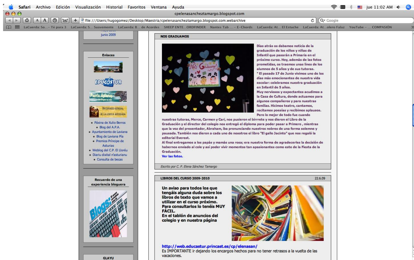
Figura 6 Imagen de blog de institución primaria

Se pudo establecer que la producción de escritos es una de las características fundamentales en el uso de los blogs y es la forma de expresión preferida en todos los blogs educativos revisados. Los blogs institucionales, sin embargo, tienen un carácter eminentemente informativo; su uso promueve el contacto entre los actores institucionales y sus estudiantes. Las instituciones los promueven porque a través del uso de los blogs, los estudiantes pueden desarrollar sus habilidades de lecto-escritura, al tiempo que participan en la vida de la organización.