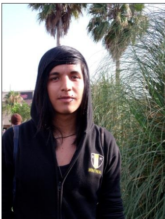
Fig. 10: Plaza Tres Cabezas 2 20