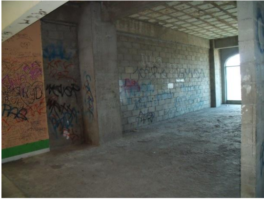
Fig. 4: Plaza Marina, local abandonado en la parte superior de la plaza