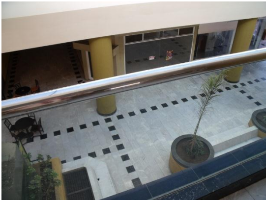
Fig. 2: Plaza Marina, pasillo entre el restaurante y cafetería