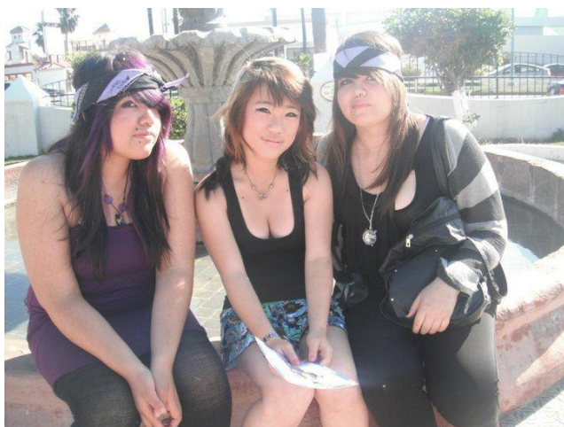
Fig. 9: Plaza de Las Tres Cabezas

Ni Omar ni Carmen pertenecen a un cierto estilo juvenil 16 , no quieren ser etiquetadas, pero lo que resalta en sus testimonios es la importancia de interactuar con sus pares. Indica Carmen que por lo general acuden cada sábado a la Plaza Marina, allí se reúnen ella y su novio con los demás. No pertenecen en sí a ningún