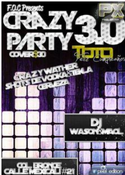
Fig. 6: Invitación a la fiesta