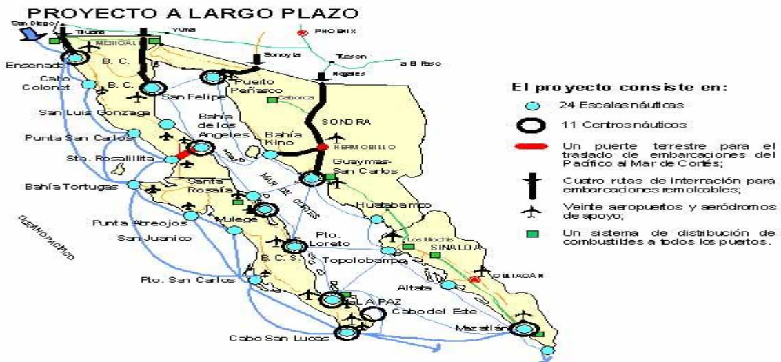
Figura 1. Localización geográfica del área de estudio, Santa Rosalía.

A escala regional, la Bahía Santa Rosalía es un subsistema de la Bahía Sebastián Vizcaíno cuyo límite norte ha sido establecido en Punta Baja, B.C., y el límite sur en Punta Eugenia, B.C.S. A meso escala las aguas de la bahía, al igual que las de la Bahía Sebastián Vizcaíno, tienen influencia directa del Sistema de la Corriente de California, la cual presenta una cobertura espacial de más de 25° de latitud. Debido a su gran cobertura espacial, este Sistema fue dividido por la U.S. GLOBEC (1994) en cuatro Regiones; en ese sentido, las aguas de la Bahía Sebastián Vizcaíno y de la Bahía Santa Rosalía, pertenecen a la Región IV, que abarca desde Punta Baja, B.C., hasta Cabo San Lucas, B.C.S. (BIOPESCA y AMRT, op.cit. ).