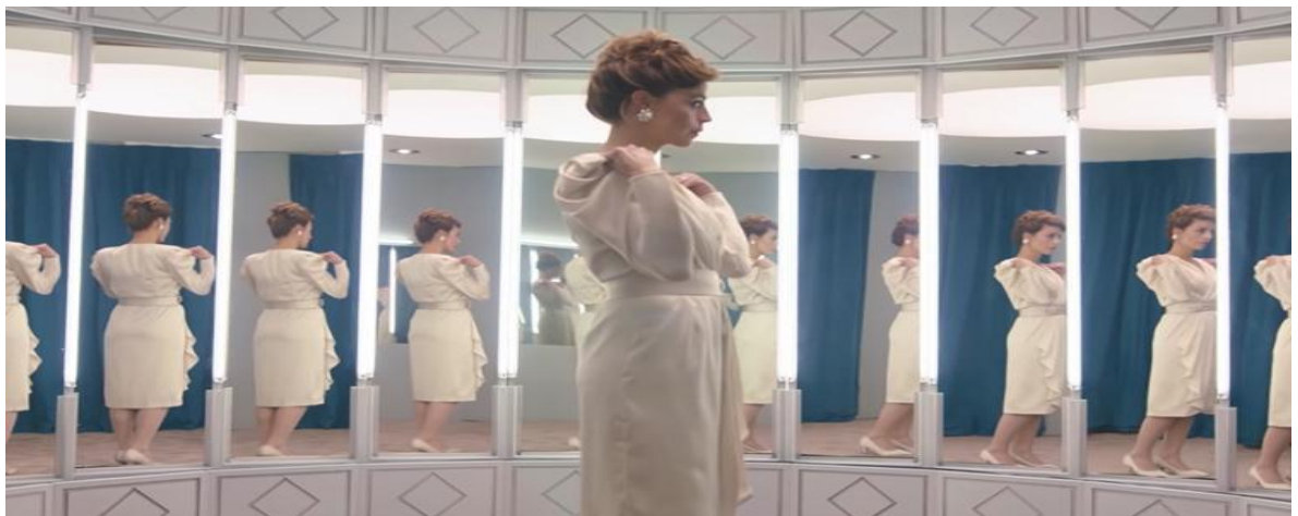
Fotograma de Las niñas bien.

La cualidad del cine de narrar en tiempo presente no implica la ausencia de un sujeto enunciator, identificarlo es uno de los primeros pasos para un análisis del discurso de la película. Aquí surge la pregunta ¿Quién nos está narrando la historia dentro de una película?, la respuesta encaja perfectamente con lo que en teoría sobre relato cinematográfico se conoce como el gran imaginador. Con el gran imaginador se hace referencia a la instancia narradora, aquel "sujeto" que nos narra la película, como se mencionó, el filme se nos está narrando en tiempo presente,