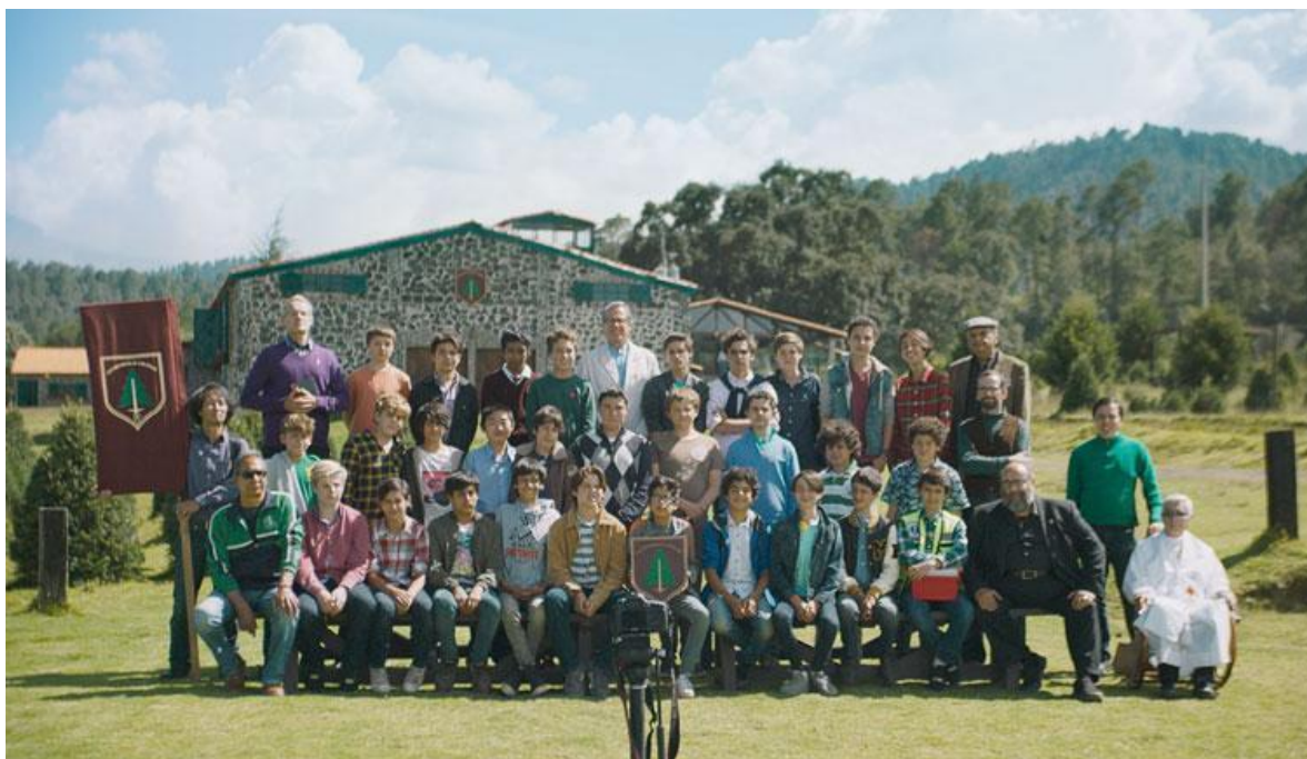
Fotograma de El hoyo en la cerca.

Santiago es un adolescente proveniente de una familia adinerada, en algún momento se alude que su padre ostenta una posición bastante prominente, pese a ello, su personaje es el de un chico demasiado noble, que no termina por adecuarse a las dinámicas de represión y abuso que realizan sus demás compañeros. Lo anterior se identifica desde el inicio de la cinta cuando le ofrece su amistad a