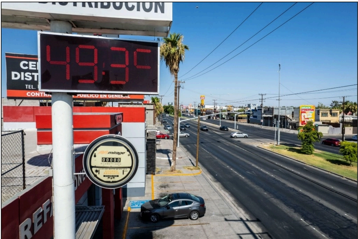
Agosto 01, 2024