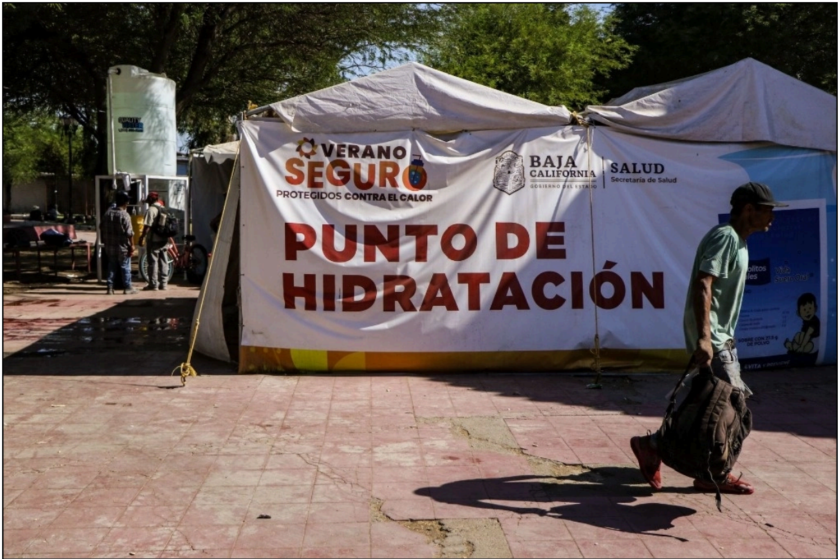
Agosto 21, 2024