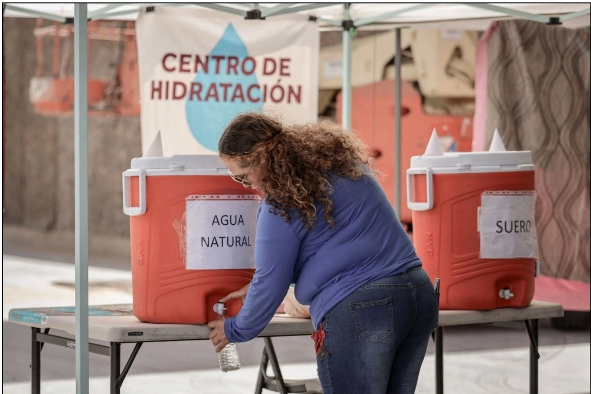
Julio 02, 2024