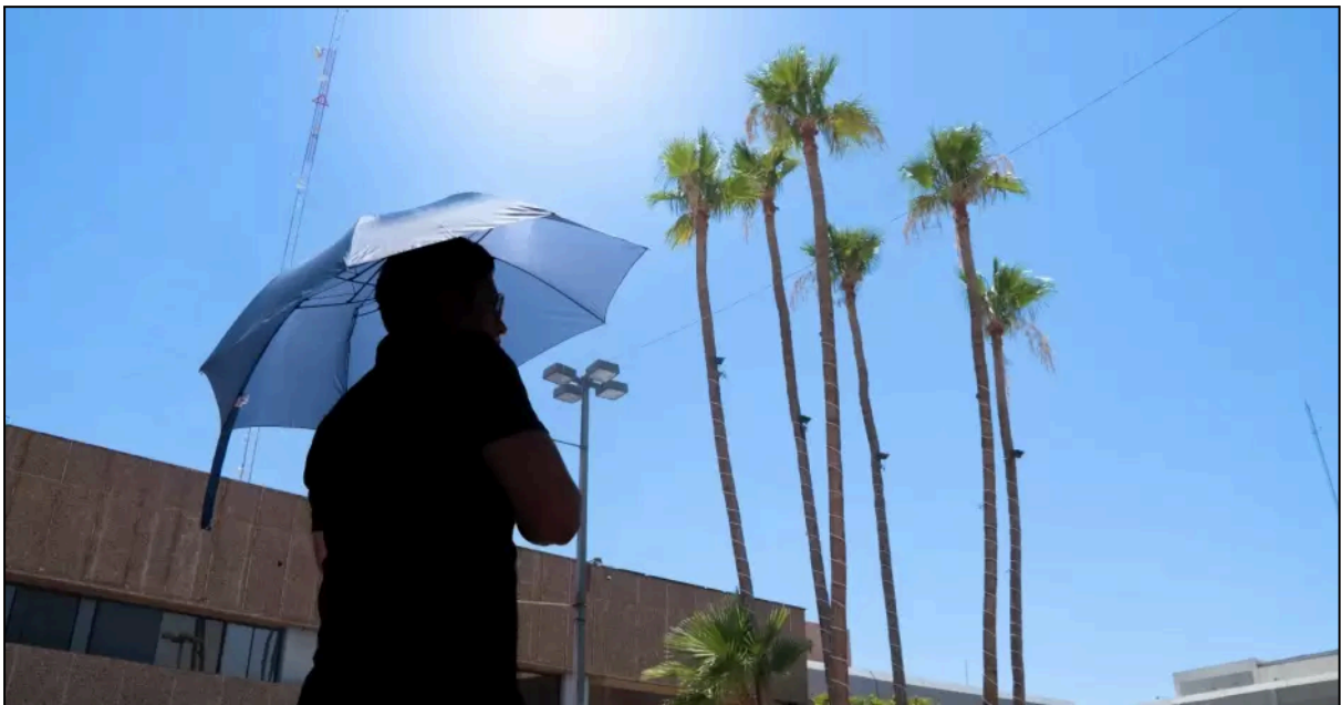
Julio 03, 2024