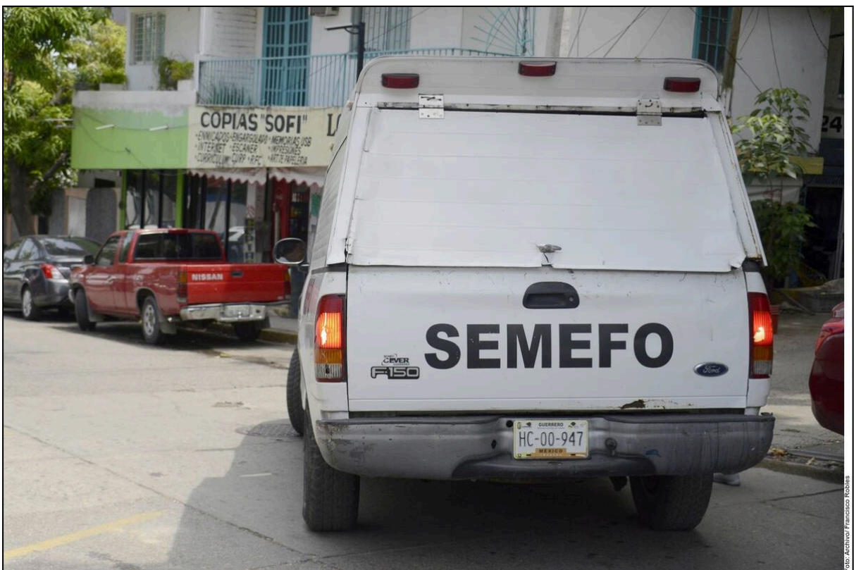
Julio 25, 2024