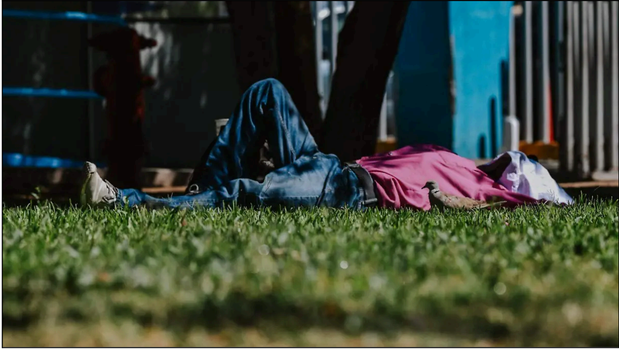
Junio 28, 2023