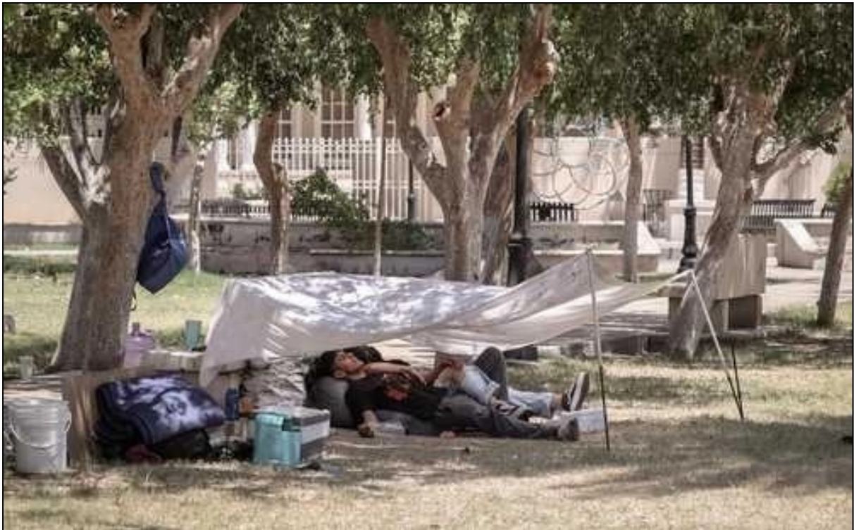
Julio 25, 2024