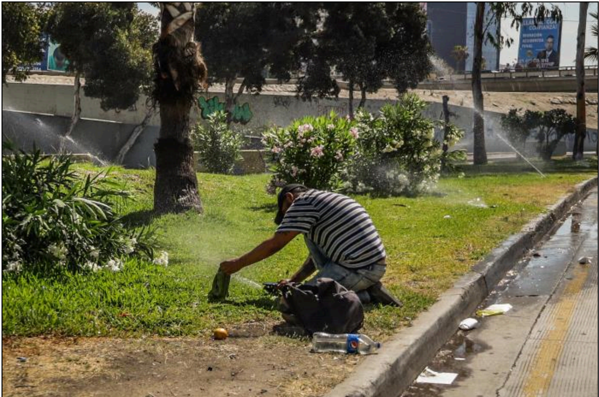
Agosto 06, 2022