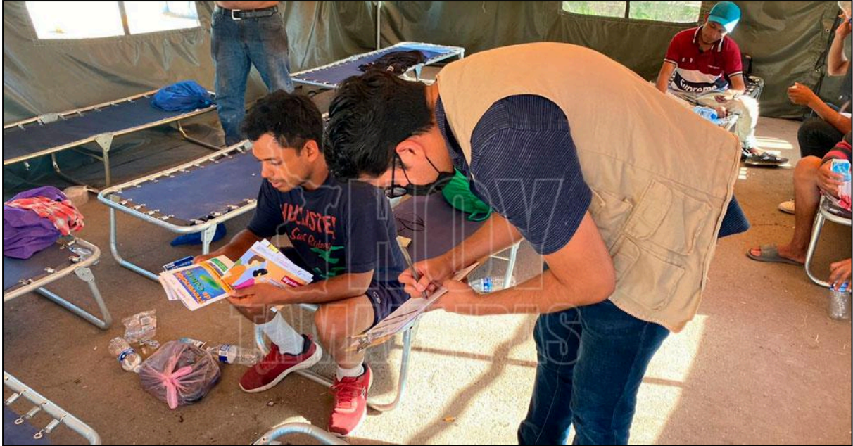
Agosto 09, 2022