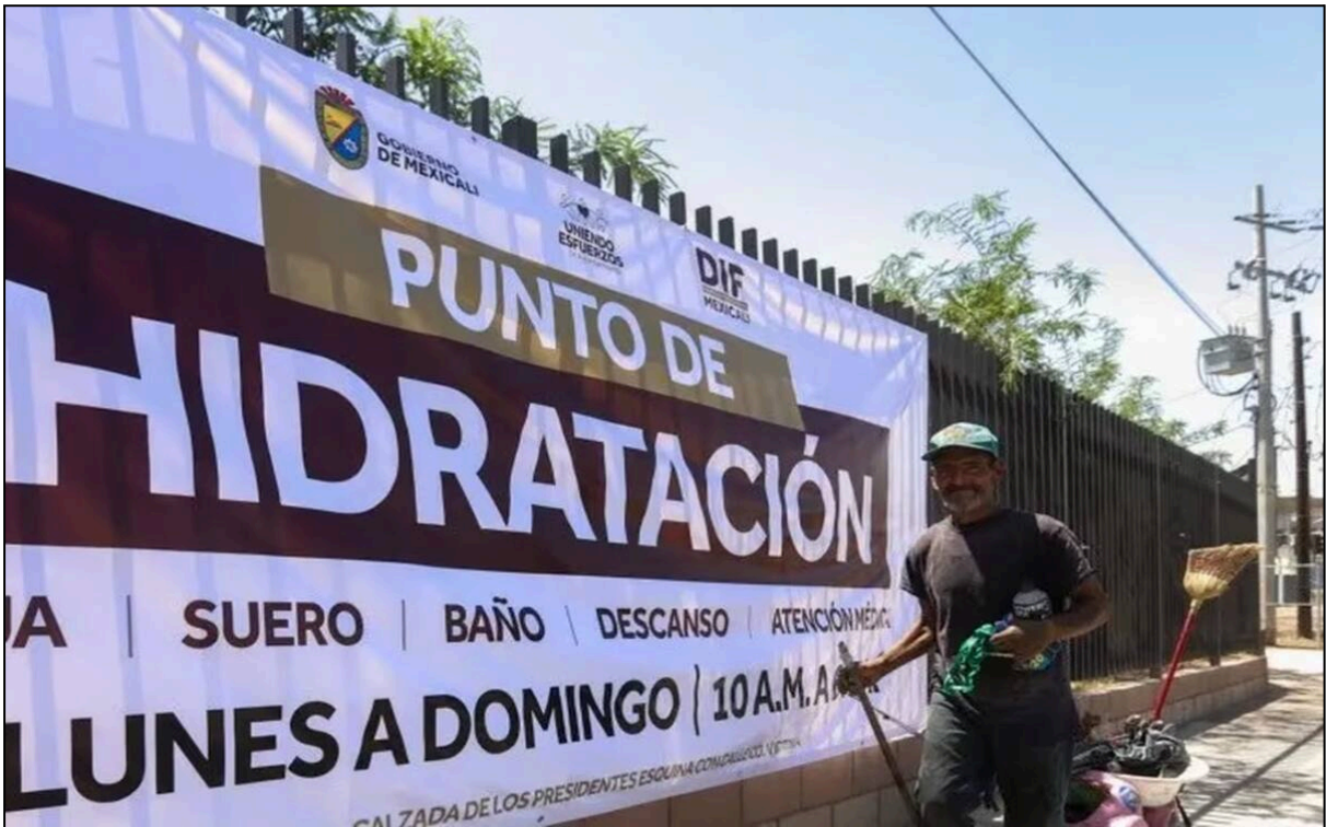
Abril 17, 2024