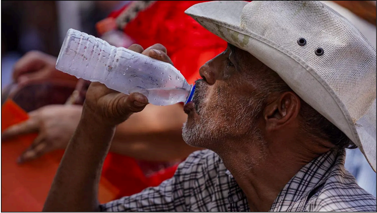
Junio 01, 2024