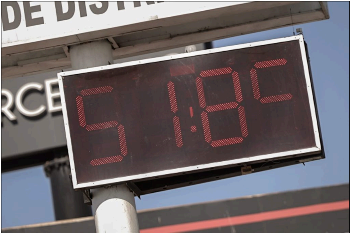
Julio 11, 2024