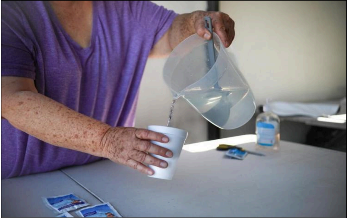
Junio 22, 2023