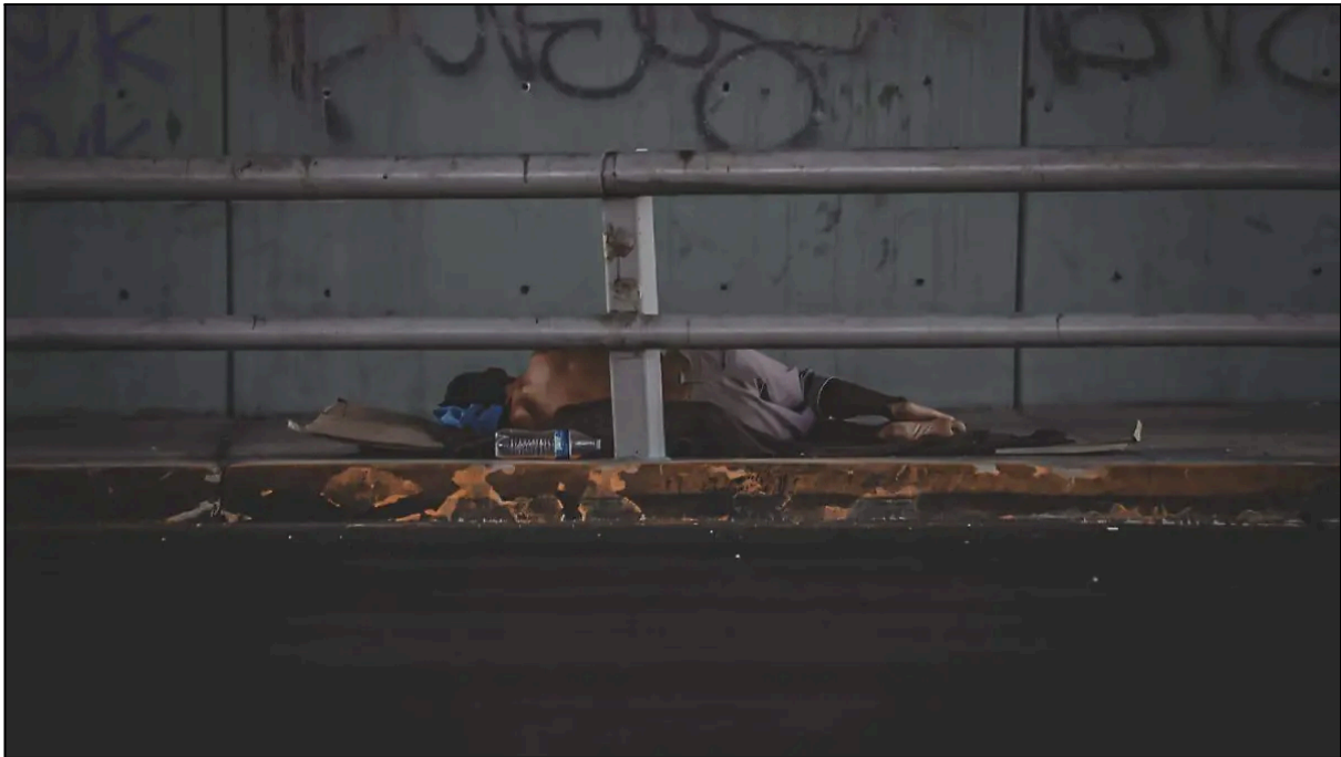
Julio 27, 2023