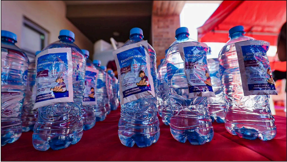
Mayo 15, 2024