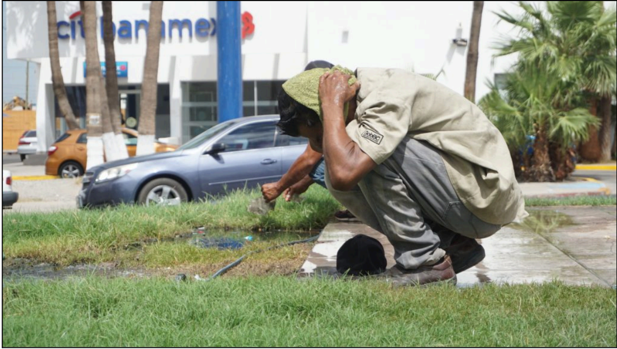
Junio 04, 2024