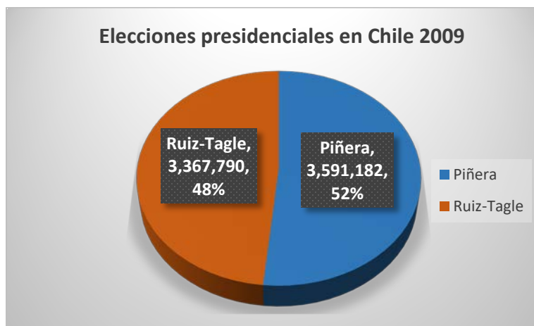
Gráfica 4. Elecciones presidenciales Chile 2009. (Elaboración propia con datos de http://www.electionresources.org/cl/ )

En el caso de Chile, la coalición por el cambio representada por Sebastián Piñera se llevó el triunfo en las elecciones presidenciales del 2009 con aproximadamente el 52% de los votos en la segunda vuelta electoral de Chile. Dicha coalición era de tendencias centro derecha con fuertes inclinaciones de políticas económicas liberales.