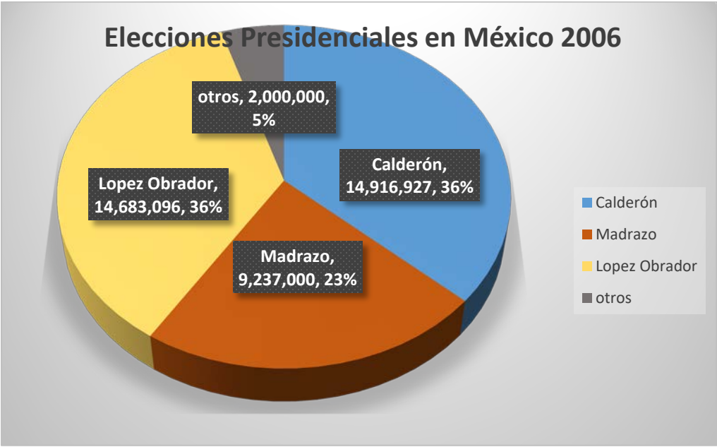
Gráfica 2. Elecciones presidenciales en México 2006 (Elaboración propia con datos de INE)