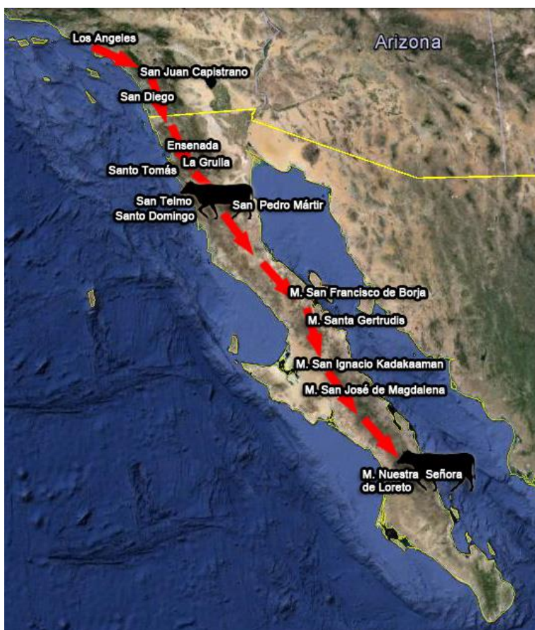
Mapa 2. Ruta ganadera de Los Ángeles, Estados Unidos-Loreto, Baja California Sur.